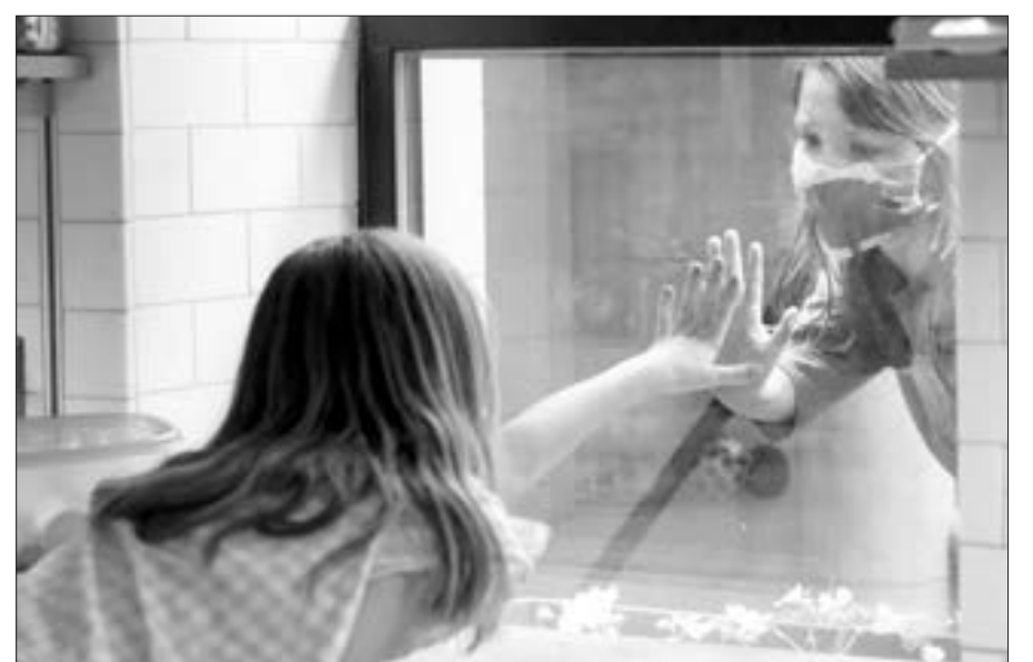
Sənin üçün çox darıxmışam...