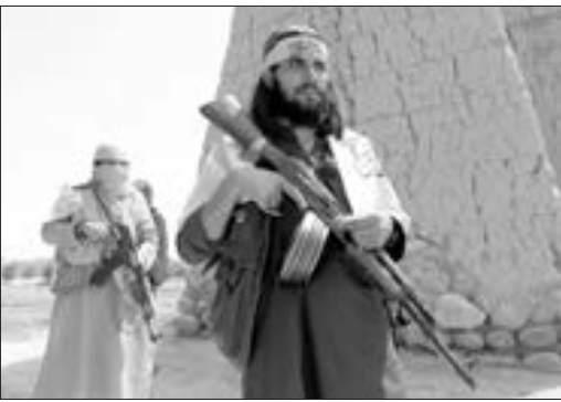
Əfqanıstanın Qəzni əyalətində yerləşən hərbi hissənin yaxınlığında minaların avtomobilin partladılması və silahlarla hücumu nəticəsində azı yeddi nəfər

həlak olub, 25 nəfər müxtəlif dərəcəli xəsarətlər alıb. İnsident mayın 18-də səhər saatlarında baş verib.