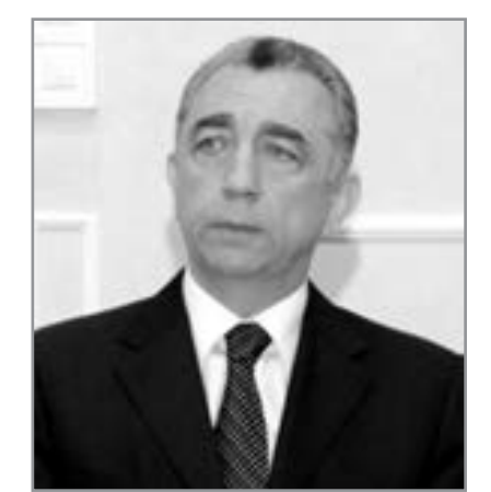
Eldar Əzizov, Bakı Şəhər İcra Hakimiyyətinin başçısı

"Bu çağırışlara Bakı Şəhər İcra Hakimiyyətinin strukturları hazır oldular. Bunun səbəbi Prezident İlham Əliyevin rəhbərliyi ilə güclü iqtisadiyyata malik Azərbaycan dövləti modelinin yaranmasıdır"