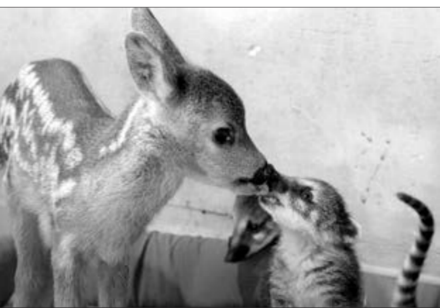
Necəsən əziz dostum...