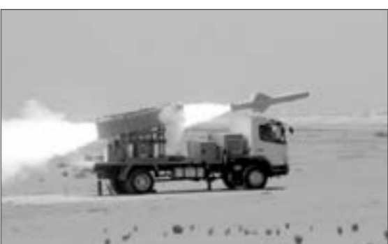
İrannın Hərbi Dəniz Qüvvələri uzaq hədəfləri vurmaq üçün nəzərdə tutulan raketini

uğurla sınaqdan keçirib. Hafta.az xəbər verir ki, bu barədə İrannın Müdafiə Nazirliyinin açıqlamasında deyilir.