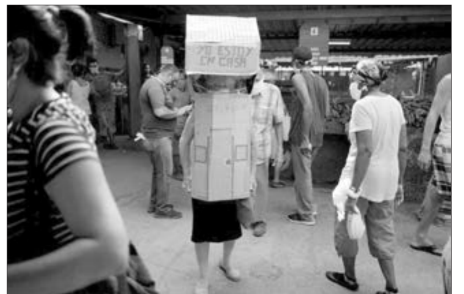
Koronavirusdan yeni qorunma üsulu...