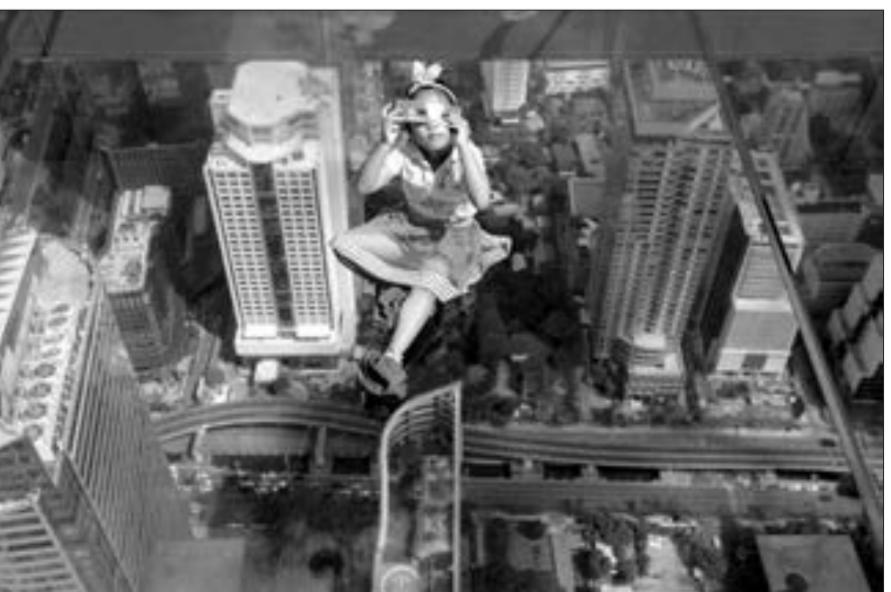
Mən havada uçuram...