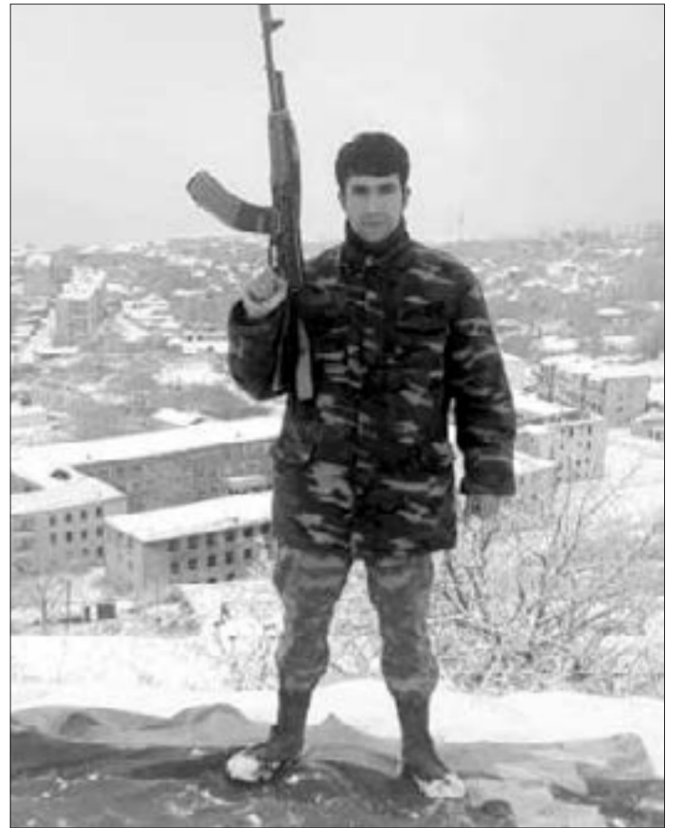
Düşməni biz oradan gözləməyirdik