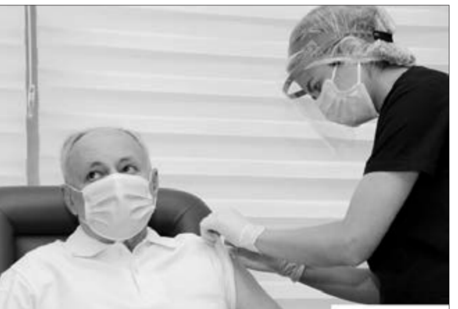
Səhiyyə naziri Oqtay Şirəliyev peyvənd olundu...