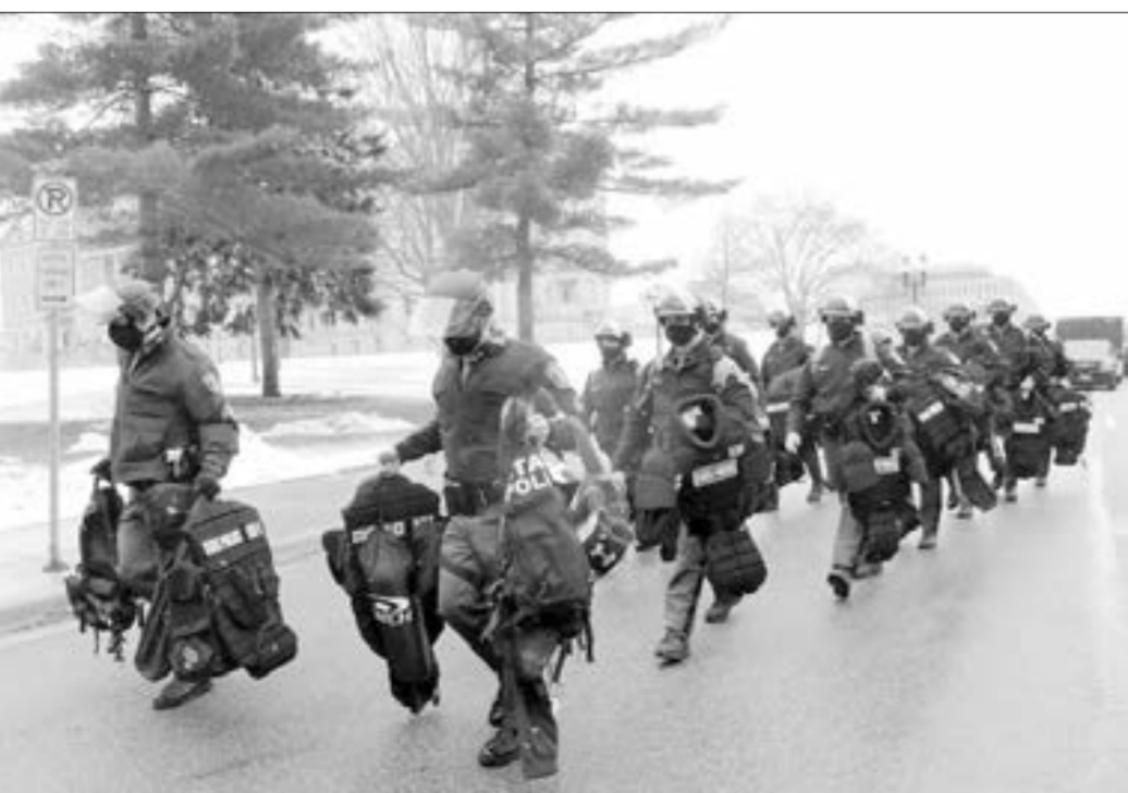
ABŞ polisi innaqurasiyaya hazırlaşır...

"Azərbaycan Qazaxıstan üçün Qafqazda əsas tərəfdaşdır"