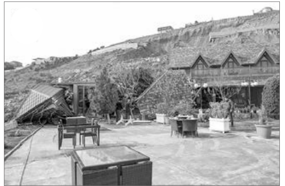
Badamdar yenidən sürüdü...