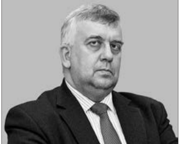
Oleq Kuznetsov, rusiyalı hərbi ekspert

Ermenistan siyasətləri isə Monitoring Mərkəzinin Ağdamda fəaliyyətə başlamasını Türkiyənin faktiki olaraq keçmiş münaqişə bölgəsində hərbi varlığının təsdiqi kimi dəyərləndirir, bunu İrəvan diplomatiyasının acı məğlubiyyəti kimi xarakterizə edirlər.