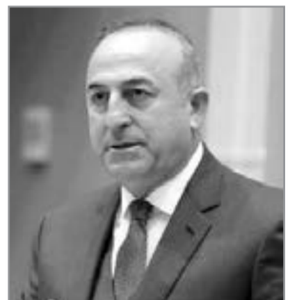
Mövlud Çavuşoğlu, Türkiyənin Xarici İşlər naziri

Cənubi Qafqazda sülh və sabitlik hər kəsin faydasıdır. Hamımız bu atəşkəsin davamlı olmasını istəyirik. Sadəcə istəmək kifayət etmir, töhfə vermək lazımdır