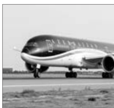
Rusiya fevralın 17-dən Azərbaycanla hava əlaqəsini rəsmən bərpa edəcək.

Müvafiq qərar fevralın 3-də Rusiya Federasiyası hökuməti tərəfindən qəbul edilmişdir. Ölkələr arasında reyslər keçən il pandemiyası fonunda dayandırılıb. Ölkələrin aviaşirkətləri