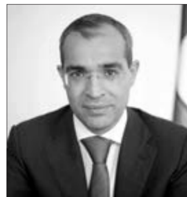
Mikayıl Cabbarov, İqtisadiyyat naziri

M.Cabbarov Azərbaycanın yeni bir strateji dövrə daxil olduğunu, işğaldan azad edilmiş ərazilərin ölkənin ümumi iqtisadiyyatına reintegrasiyası, Qarabağ bölgəsinin inkişafına nail olunması və onun iqtisadi imkanlarının reallaşdırılmasının təkcə