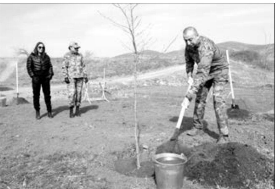
Zəngilanda tarixi çinar meşəliyi bərpa edilir...