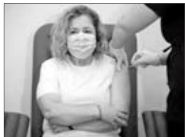
Ümumdünya Səhiyyə Təşkilatının Azərbaycanı nümayəndəliyinin rəhbəri

Hande Harmancı COVID-19-a qarşı peyvənd olub. H.Harmancınnin vaksinasiyası Bakı Sağlamlıq Mərkəzində aparılıb.