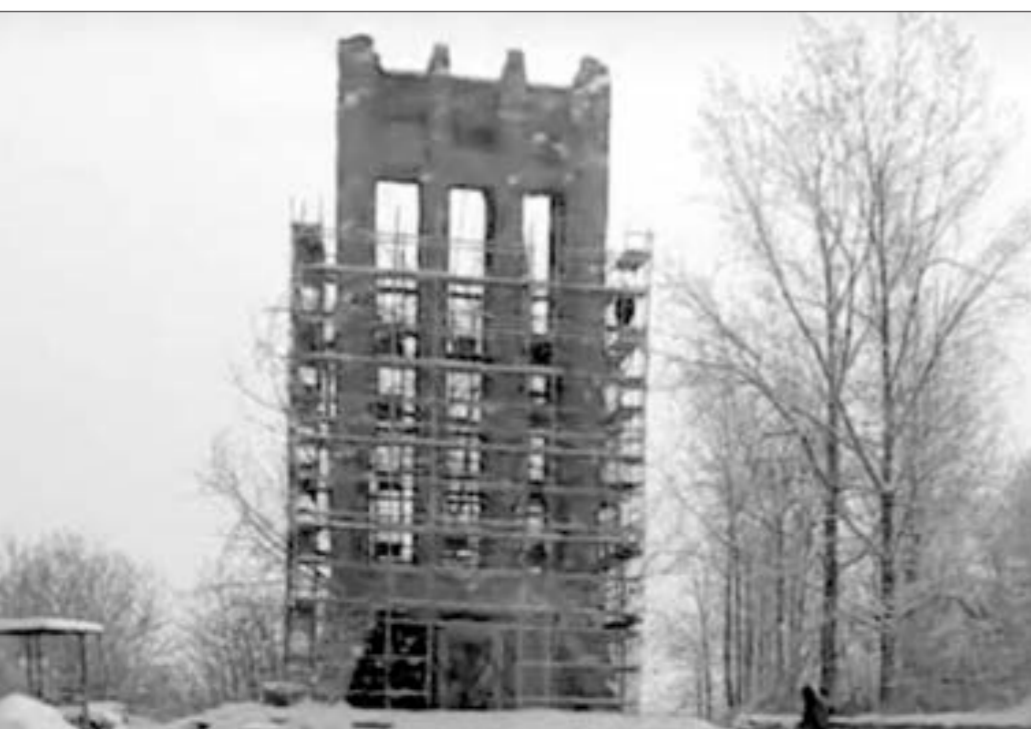
Şuşada Molla Pənah Vaqifin məqbərəsi bərpa edilir...

“ Ali məktəblərə “tədqiqat universiteti” statusu niyə verilmir?