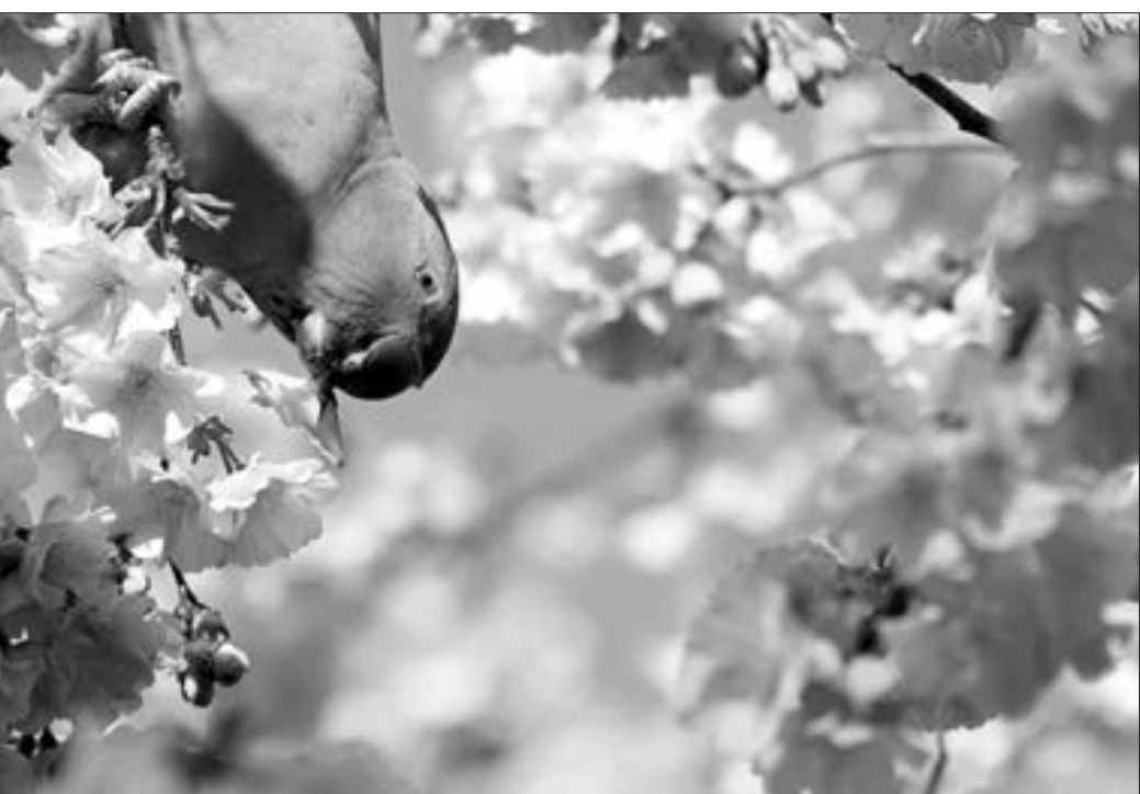
Tutuquşular Londonda yazın gəlişini qeyd edir...