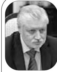
Sergey Mironov, "Ədalətli Rusiya"nın lideri

Biz Rusiya hakimiyyətinin seçkilərimizə müdaxilə etməsinə, hərbiçilərimizin öldürülməsinə mükafat təyin etməsinə, ölkəmizə qarşı zərərli fəaliyyəti göstərmələrinə dözü bilmərik. Prezident açıq və birbaşa olacaq. O, deyilməsi lazım gələndə sözləri yumşaltmayacaq.