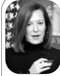
Cen Psaki, ABŞ prezidentinin mətbuat katibi

Rusiyada siyasətçilər və jurnalistlər də daxil olmaqla, fiqurantlarla bağlı uzun qətl siyahısı var. Aleksey Navalni olayı ilə bağlı isə AB sanksiyası tətbiq edib. Rusiya hakimiyyəti Ukraynada hüquqazidd əməllər törədib və qonşu ölkələrdə konfliktlərdə açıq-aşkar rol oynayır. Rusiya prezidenti olanlara görə məsuliyyət daşıyır.