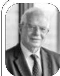
Jozep Borrell, Avropa Birliyinin ali nümayəndəsi

Vyaçeslav Volodin, Rusiya Dumasının spikeri ABŞ Prezidenti Cozef Baydenin son bəyanatı gücsüzlükdən doğan istehkəkdir. Bayden özünün bəyanatı ilə ölkəmizin vətəndaşlarını təhqir edib. Putin bizim prezidentdir. Putinə hücum - Rusiyaya hücmdür.