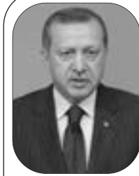
Rəcəb Tayyib Ərdoğan, Türkiyə Prezidenti

Bayden-Putin qarşıdurmasına dünya liderləri və amerikalı, rusiyalı siyasətçilərin, ekspertlərin yanaşmaları da maraqlıdır. Kimisi Ağ ev rəhbərini, kimisi Kreml sahibini haqlı sayır. Hafta.az onlardan bəzilərini sizlərə də təqdim edir.