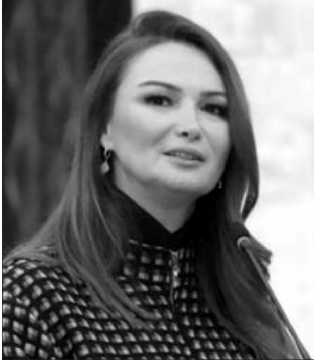
Qənirə Paşayeva, Milli Məclisin Mədəniyyət Komitəsinin sədri, millət vəkili

qabaqlamaq istəmirəm ancaq zaman içində, mədəniyyət ictimaiyyətinin düşündürən məsələlərin qanunvericilikdə öz praktik həllini tapması üçün müvafiq işlər görülməlidir.