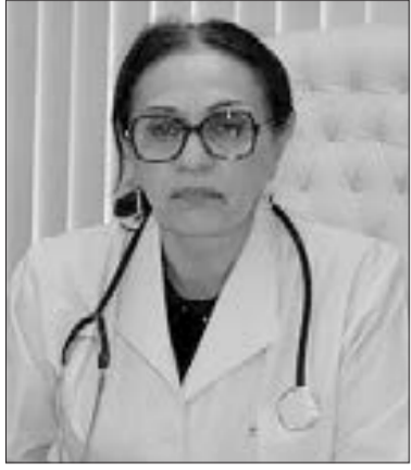
Lalə Allahverdiyeva, Səhiyyə Nazirliyinin baş allerqoloqu

A llergiyadan əziyyət çəkən xəstələr COVID-19-un inkişaf etməsinə görə risk qrupuna daxil deyil. Hafta.az-ın məlumatına görə, bunu Səhiyyə Nazirliyinin baş allerqoloqu Lalə Allahverdiyeva deyib.