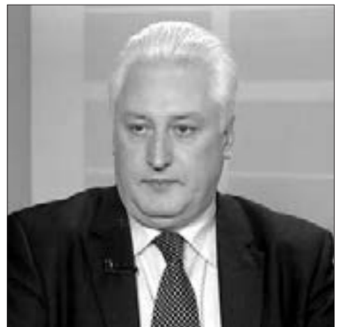
İqor Korotçenko, rusiyalı hərbi ekspert

Qisas səsləyən istənilən erməni siyasətçi Kremlin mənfəəti ilə üzleşəcək. Paşinyan bunu anlayır və bu barədə dəqiq signal ötürür. 30 il necə böyük xalq, qalib olduqlarını qışqırırdılar. Nəticədə 10 min fərarı... Bu səbəbdən qisas barədə qışqırmaq əvəzinə Azərbaycana münasibətdə, ətraflarına münasibətdə şovinist baxışların, milli ideologiyalarının nəticə-