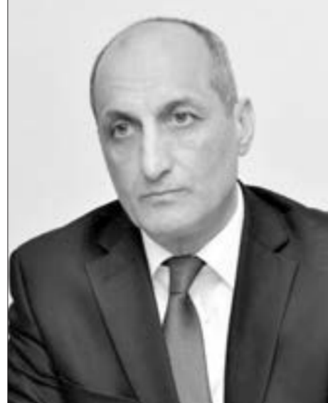
Fikrət Yusifov, sابق maliyyə naziri, professor

"Məsələ ondadır ki, Azərbaycan aqrar ölkədir. Bir sıra məhsulların istehsalı üçün ölkədə əlverişli iqlim mövcuddur. Bu səbəbdən aqrar sektorun inkişafı üçün çox böyük perspektivlər və ehtiyatlar var. Ona görə də dövlətimiz ölkə iqtisadiyyatının neftdən asılı-