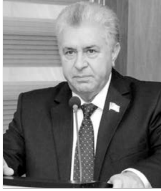
Fəzail İbrahimli, Milli Məclisin sədr müavini

44 günlük Vətən Müharibəsində əldə olunan hərbi qələbədən sonra Ağdam, Kəlbəcər və Laçının bir güllə atılmadan azad edilməsi müharibənin sülhlə əvəzlənməsi prosesində diplomatiyanın ilk uğuru kimi dəyərləndirilir. Görünən odur ki, üçtərəfli bəyannaməyə əməl etməyən Ermənistan sülhə gəlmir. O zaman Azərbaycan nə zamana qədər səbrlə davranmalı və humanist addımlarını davam etməlidir? Bu və digər məsələlərlə bağlı "Həftə içi" nə müsahibə verən Milli Məclisin sədr müavini Fəzail İbrahimli mövcud vəziyyətlə bağlı ortaya çıxan narahatlıqlara aydınlıq gətirib.