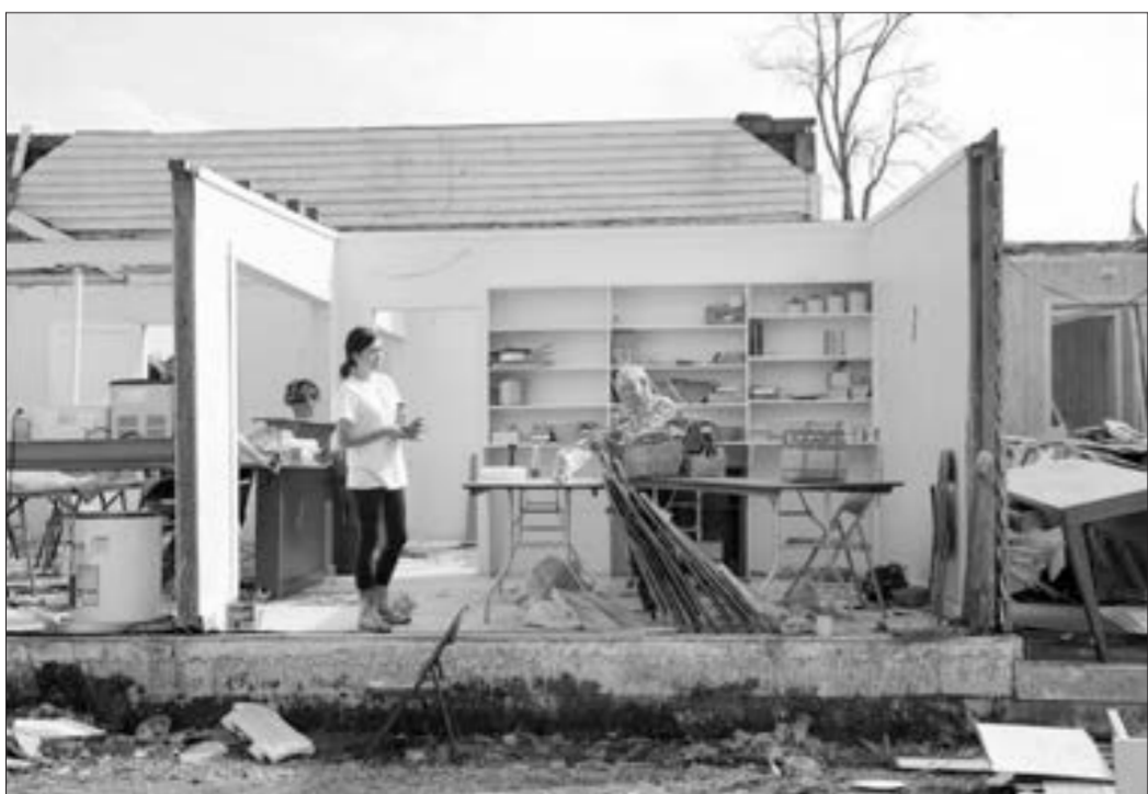
Alabamada tornadodan geriyyə qalanlar...