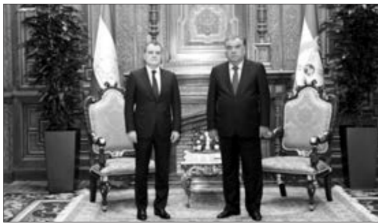
fərlərini məmnunluqla xatırlaya bilməyən Ceyhun Bayramovun Azərbaycan Prezidentinə təşəkkürünü ifadə edib və Azərbaycan Respublikası Prezidentinin səmimi səfərə dəvət edib.

Martin 29-da Azərbaycan Respublikasının xarici işlər naziri Ceyhun Bayramov Tacikistan Respublikasının Prezidenti Emomali Rahmon tərəfindən qəbul edilib.