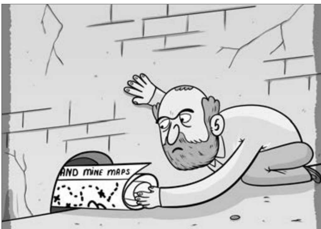
Paşinyanın kirli xəritə "oyunu"