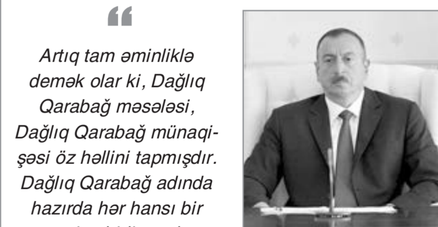
İlham Əliyev, Azərbaycan Prezidenti