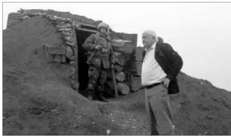
Aqil Abbas, Milli Məclisin deputatı

"İmarət"də olanda bir də gördüm ki, xaricilərdən ibarət nümayəndələr gəldilər. Hikmət Hacıyev onlarla idi. Mənə dedi ki, buraları daha yaxşı bilirsen, sən məlumat ver. Danışdım, onlara ingilis dilində tərcümə elədim.