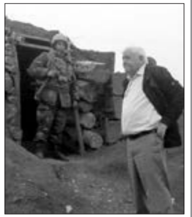
Aqil Abbas, Milli Məclisin deputatı

44 günlük Vətən müharibəsi Azərbaycanın ömrünə qızıl hərflərlə zəfər tarixi yazdı. Torpaqları azad olunan insanlarımız uzun illər çəkdiyi ağrı-acı, həsrətdən sonra Vətənlə birlikdə yenidən doğuldu, 30 il ona unudurulan doğum günlərini yada saldı, Vətənlə birlikdə yaşadı azadlığını... Bu günlər özünün 68-ci doğum gününü işğaldan azad olunan vətəninə - Ağdamda keçirməyi arzu edən yazıçı, millət vəkili Aqil Abbas kimi... Doğum günü bə verən Aqil Abbas maraqlı məsələlərə diqqət çəkib.