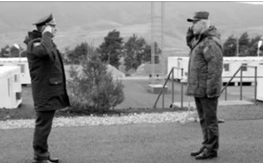
Rusiya müdafiə nazirinin müavini, ordu generalı Dmitri Bulqakov Qarabağa səfər edib...