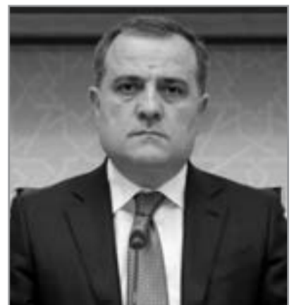
Ceyhun Bayramov, Azərbaycanın xarici işlər naziri

"Azərbaycan üzərinə götürdüğü öhdəliklərə tam sadıqdır və üçtərəfli bəyanata uyğun olaraq bütün hərbi əsirləri Ermənistanə qaytarıb"