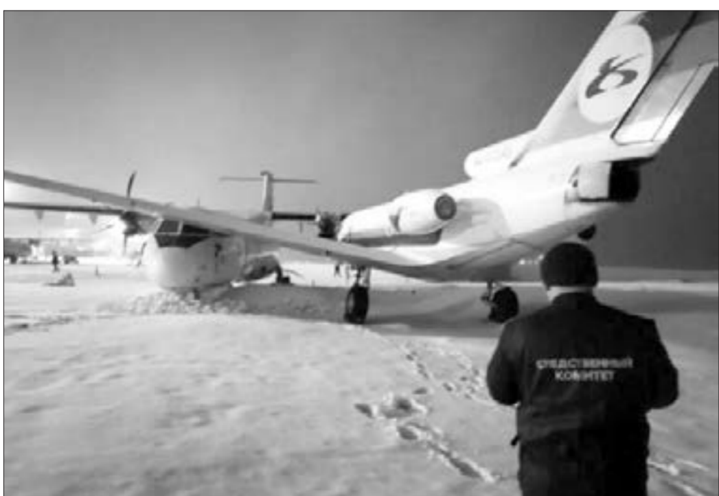
Rusiyada enmə zolağında iki təyyarə toqquşdu...

Gender əsaslı zorakılıq qurbanlarının diqqətinə