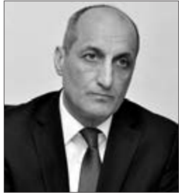
Fikrət Yusifov, İqtisadçı alim, sabiq maliyyə naziri

" Bununla bağlı xüsusi qurum təsis edilməlidir. Həmin quruma hökumətin rəhbər şəxslərindən təyinat olunmalıdır "