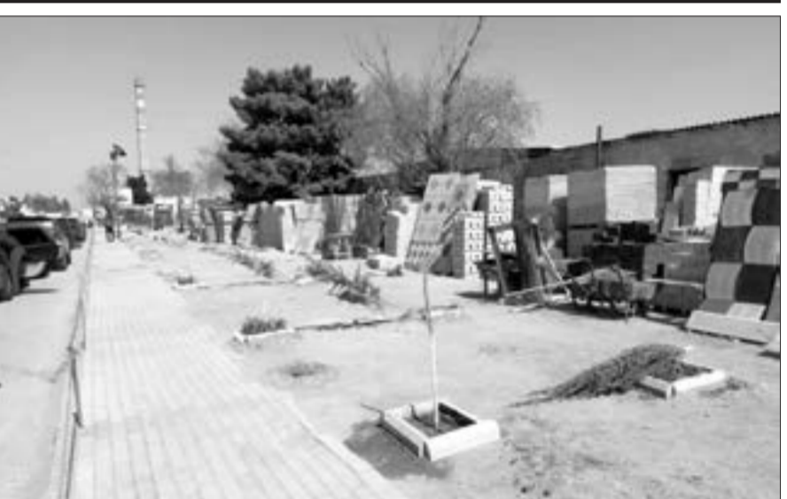
Ziya Bünyadov prospekti, 1 ünvanında 60-dan çox ağac kəsilib...