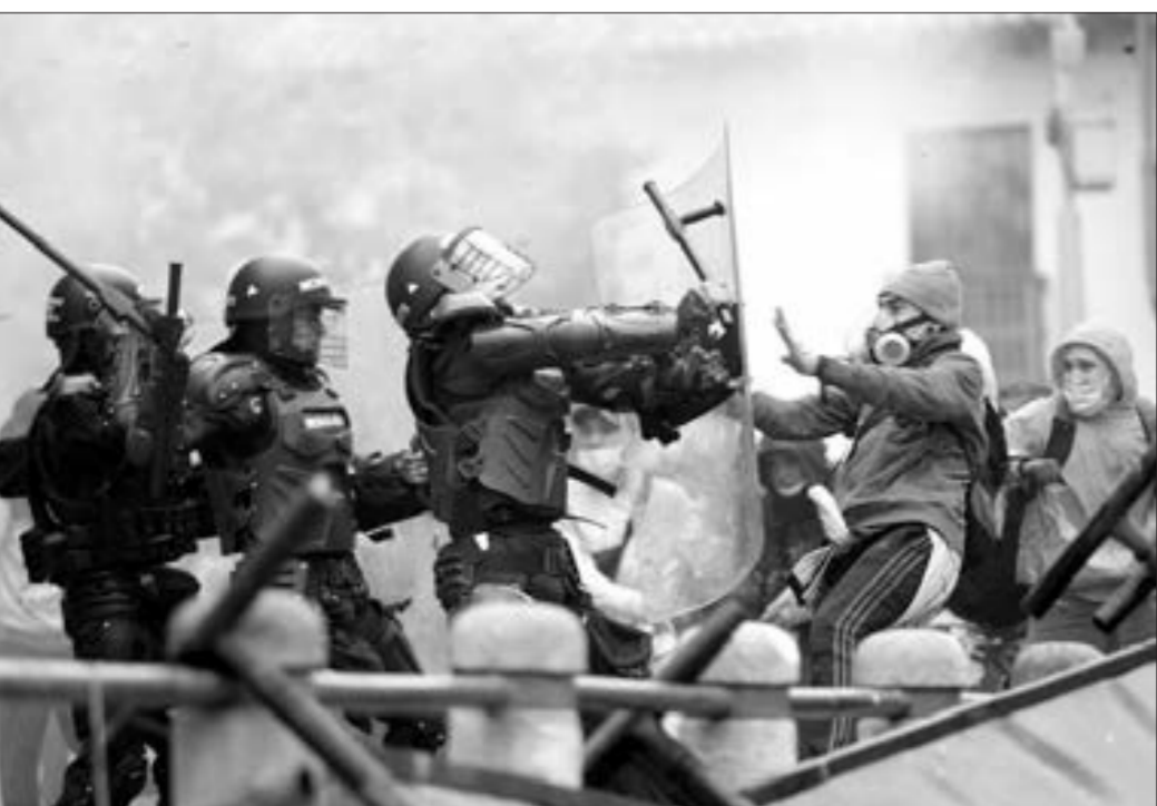
Kolumbiyada vergi islahatları ilə bağlı etirazlar...