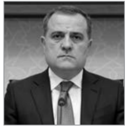
Ceyhun Bayramov, Azərbaycanın Xarici İşlər naziri

Məcburi köçkünlərin işğaldan azad olunan torpaqlara qayıtması üçün sistemli və ardıcıl addımlar atılır