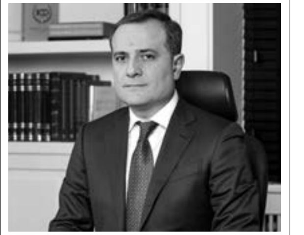
Ceyhun Bayramov, Azərbaycanın Xarici İşlər naziri

"Üçtərəfli bəyanatların icrası istiqamətində müsbət işlər görülüb". Bunu Azərbaycanın xarici işlər naziri Ceyhun Bayramov Bakıda səfərdə olan Litvanın xarici işlər naziri ilə birgə mətbuat konfransında deyib. O qeyd edib ki, Azərbaycan tərəfi bütün öhdəliklərini məsuliyyətlə yerinə yetirir və noyabrın sonunda hərbi əsirlərin mübadiləsi başa çatıb. "Ötən il noyabrın sonunda xüsusi əməliyyat nəticəsində Azərbaycan ərazisində qeyri-qanuni keçən 62 nəfər tutulub.