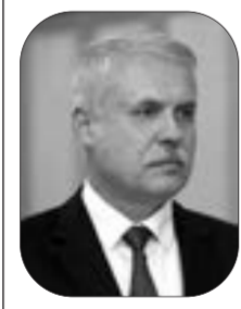
Stanislav Zas, Kollektiv Təhlükəsizlik Müqaviləsi Təşkilatının Baş katibi:

- Tacikistanla Qırğızistan arasında münaqişə sülh yolu ilə həll olunmalıdır. Təşkilat baş verənləri diqqətlə izləyir və təhlil edir. Kollektiv Təhlükəsizlik Müqaviləsi Təşkilatı olaraq hesab edirik ki, yaranmış münaqişəyə son qoyulmalıdır. Hazırda bu məsələnin sülh yolu ilə nizamlanması üçün bütün mümkün tədbirlər görülür.