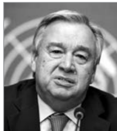
Antonio Quterres, BMT-nin Baş katibi

Mən bütün hökumətləri azad, müstəqil və fərqli medianı dəstəkləmək üçün əllərindən gələni etməyə çağırıram