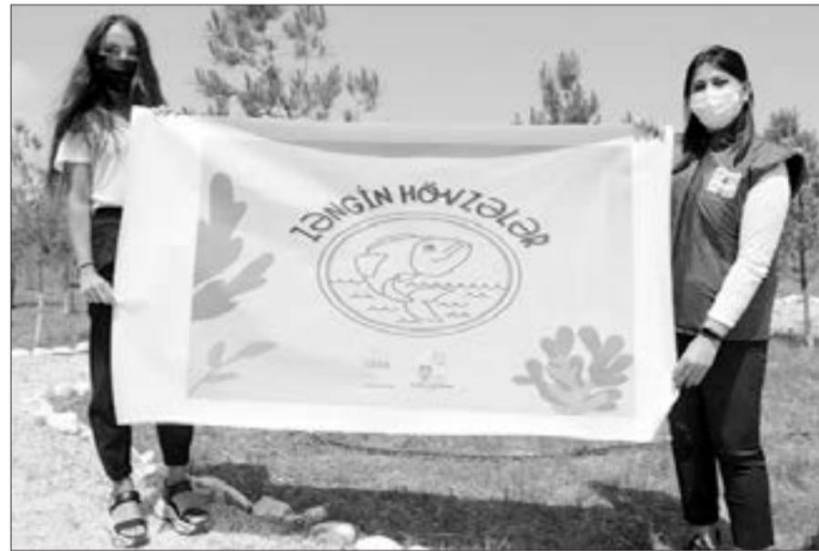
Leyla Əliyeva Qızılağac Milli Parkında...