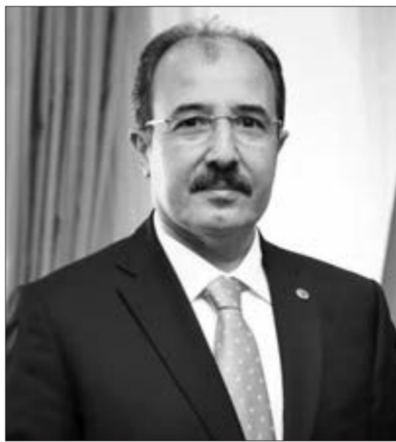
Cahit Bağcı, Türkiyənin ölkəmizdəki səfiri

"Azərbaycanın qədim torpağı Qarabağda ermənilərin təxmindən otuz illik qanlı işğalına 44 gün sürən Vətən Müharibəsi nəticəsində son qoyuldu. Son zamanlar Azərbaycan - Türkiyə münasibətlərində bütün sahələrdə böyük irəliləyiş qeydə alınıb: "Bu zəfər qardaşlığımız qədr bizi - Türkiyədəki vətəndaşlarımızı da sevindirir. Türkiyə bu müharibədə qardaşlığın tələblərinə əsasən Azərbaycanı yalnız buraxmadı. Müharibənin başından axırınadək qardaşlığımızın yanında olduq, hər cür dəstək verərək dostu və düşməni birliyin gücünü isbatladığımızı. Biz inənir ki, artıq Qarabağdakı xarı bülbüllər hər bahar şəhidlərimiz üçün açacaq, onların qoxu-