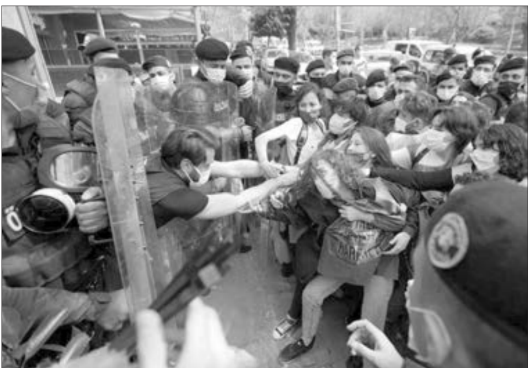
Türkiyədə 1 May nümayişlərindən maraqlı görüntü...