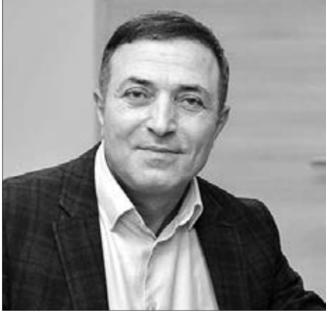
Mensum İbrahimov, Xalq artisti