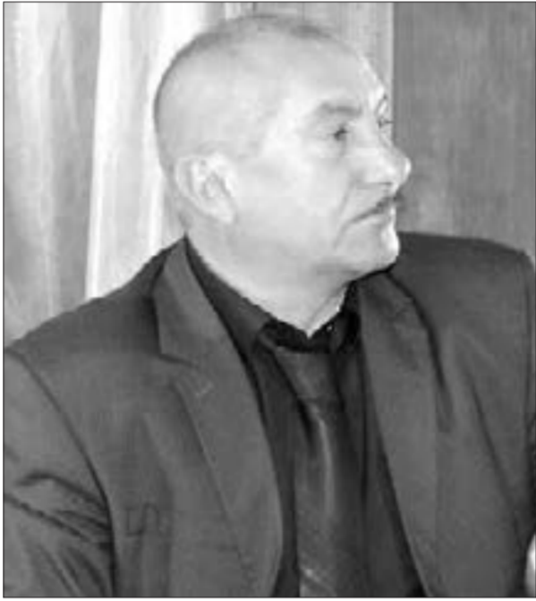
Arif Paşa, Laçın alayının qurucusu və komandiri, ehtiyatda olan polkovnik

- Bildiyiniz kimi, 1987-ci ildə Azərbaycan