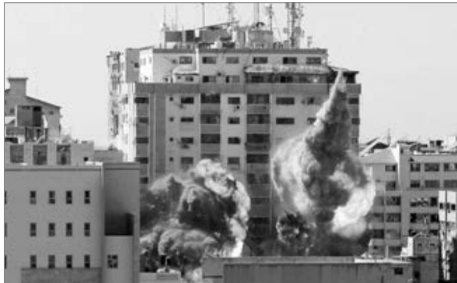
Qazaxda Associated Press və Al Jazeera'nın ofisinin yerləşdiyi Al-Jalaa binasının partladılması anı...