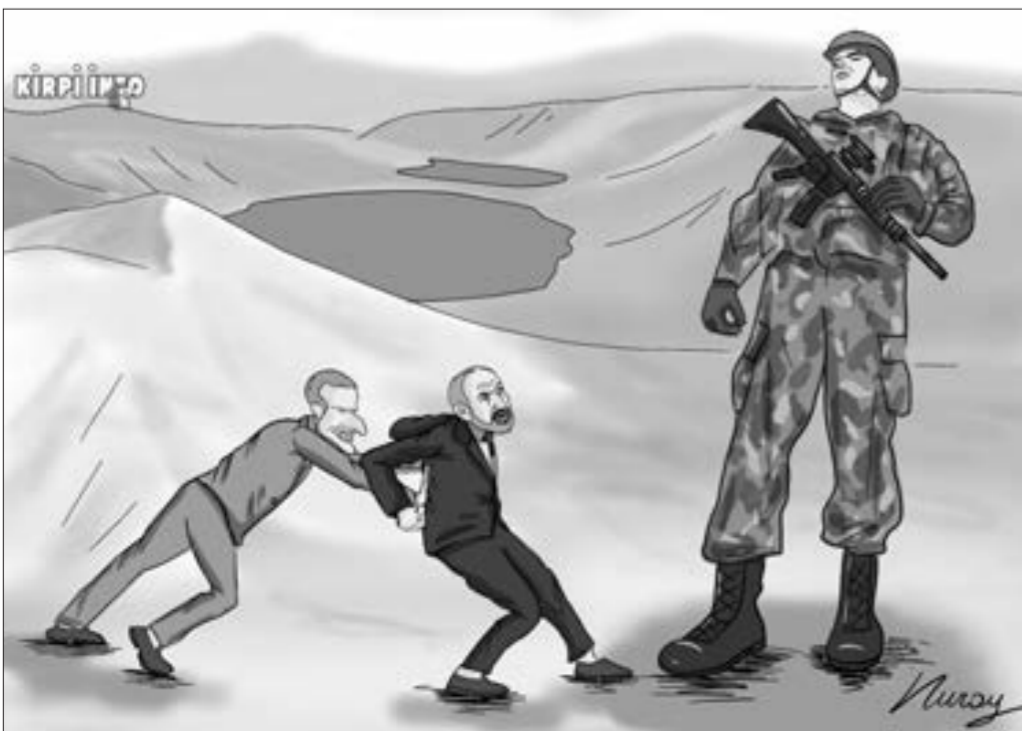
Makron yenə öz dəstəyini əsirgəmir...

"Şuşada 300-dən çox abidəni qeydiyyatda almışıq"