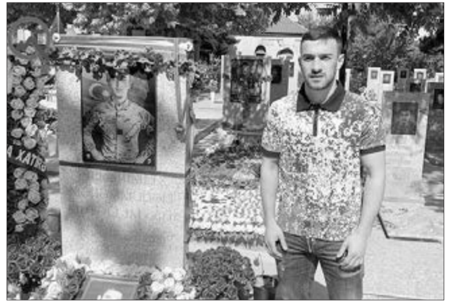
"Qarabağ"ın futbolçusu medalını şəhid məzarından asdı...