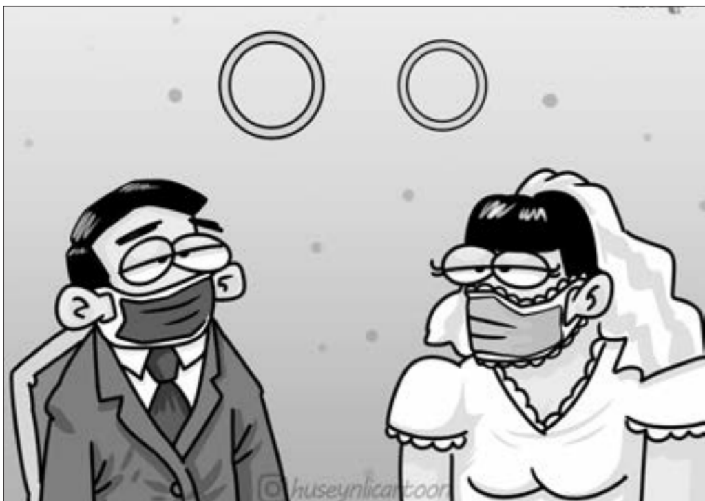
Toylarla bağlı yeni qaydalar hazırlanır...

"Azərbaycanfilm" müharibəyə dair filmlər hazırlayır