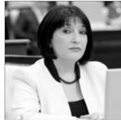
Sahibə Qafarova, Milli Məclisin sədri

“Avropa Parlamentində “hərbi əsir”lərlə bağlı qəbul edilən qətnamə təəssüf doğurur”. Bunu Milli Məclisin sədri Sahibə Qafarova deyib.