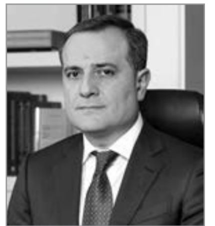
Ceyhun Bayramov, Xarici İşlər naziri

Təəssüf ki, hələ də Ermənistan tərəfindən 10 Noyabr tarixli bəyanatdan və ümumilikdə, beynəlxalq humanitar hüquqdan irəli gələn öhdəliklərinin pozulmasının şahidiyik