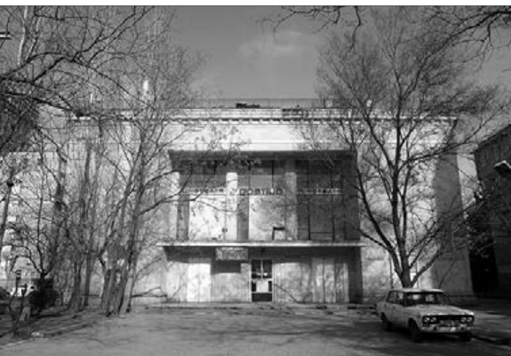
"Dostluq" kinoteatrı sökülür...

“ Ermenistan beynəlxalq hüququ kobud şəkildə pozur