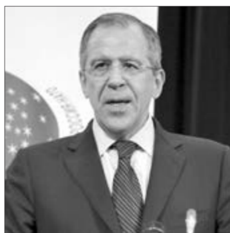
Sergey Lavrov, Rusiyanın xarici işlər naziri

baycanla Ermənistan arasında kommunikasiyaların açılmasında təkə bu iki ölkə yox, Rusiya, Türkiyə və İran da maraqlıdır, bu ölkələrin fikrini danışıqlar prosesində nəzərə almaq lazımdır. "Dağlıq Qarabağın statusu məsələsini