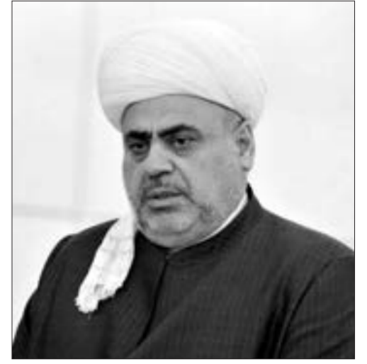
Şeyxülislam Allahşükür Paşazadə, Qafqaz Müsəlmanları İdarəsinin (QMİ) sədri

Militarist ritorikası və davranışı tarixdə heç kime fayda verməyib. Müharibə