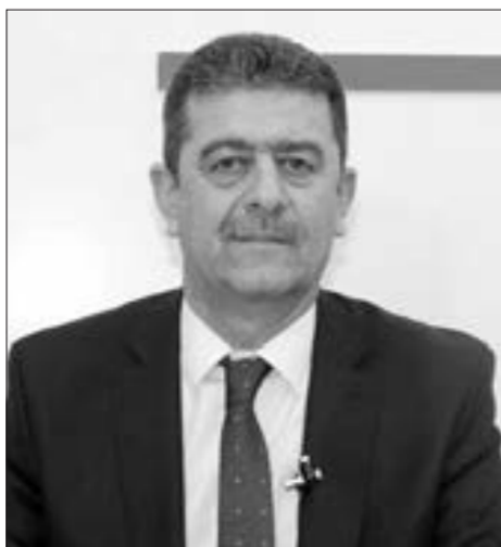
Elşad Musayev, Böyük Azərbaycan Partiyasının sədri

ramlı qüvvələri, monitorinq qrupu ilə düzgün işin qurulması ilə bağlıdır. Proses gözlənilən şəkildə inkişaf edir. Mənə belə gəlir ki, xəritələr verilənə qədər Azərbaycan öz gücünə minə sahələrini təmizləməyə nail olacaq. Ermənilər müəyyən bir şəkildə döyüşlər getməyən ərazilərdə - Kəlbəcər və Laçında xaos minalar yerləşdirib. Bunun nəticəsində jurnalist həmkarlarımız, digər mülki vətəndaşları itirdik. Erməni hərbiçisi 17 maşın minanın ərazilərdə yerləşdirildiyini etiraf edir.