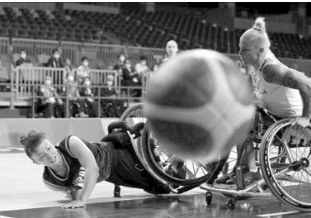
Tokioda paraolimpiya oyunları başladı...