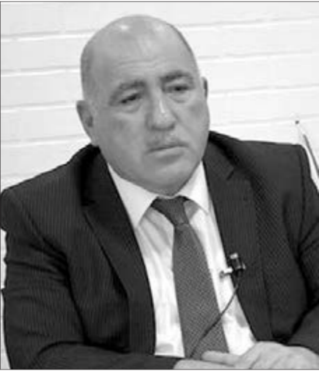
Pənah Hüseyn, Xalq Partiyasının sədri

R egiondakı vəziyyət gərgin olaraq qalır. İctimai-siyasi gündəm, geopolitik durum o qədər qarışıqdır ki, proseslərin düzgün məcraya yönəlməsi ağıllı və qətiyyətli tədbirlərin görülməsini tələb edir. Bunun üçün siyasi partiyalar nə edir, nə düşünür? Bu və digər məsələlərlə bağlı hafta.az -a müsahibə verən Xalq Partiyasının sədri Pənah Hüseyn maraqlı nüanslara diqqət çəkib.