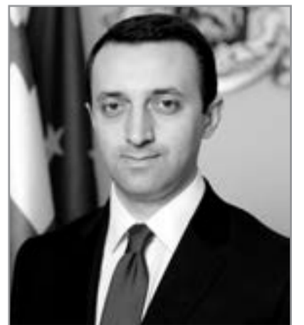
İrakli Qaribaşvili, Gürcüstanın Baş naziri

“ Qarabağ müharibəsi region üçün çətin çağırış idi. İnanıram ki, bu çağırış yeni fərsətlərə çevriləcək ”