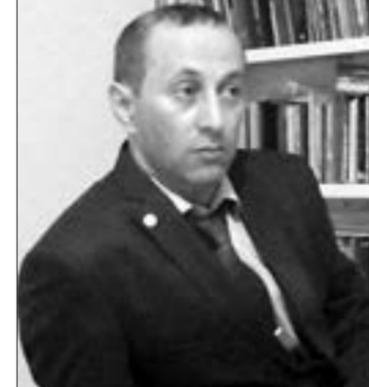
Bu dünyanın balaca fidanı

xəzan olan yarpaqların arasında öz qələmini tapmış və ondan bərk-bərk yazıb dikələrək, bu qələmin gücünə beləld olduğundan ona söykənbir var gücü ilə, səsi gəldikcə, sözü yetdikcə; "...ey kor olmuş dünya, mən də varam" - deyə həyriyyətdir. O qələm onu çox firtinalarla qarşılaşdırmış, o kiçik, məsum ürəyində öz qələmi qalmışdır. Bu odun qor götürdüyü ocaq başpəriyyətin söz məbədinin müdaxiləsinə müqəddəslik qatan pərinəsin pirdir. Bu od herdən sənə də, hər dəfəsində yenidən daha güclü alovlanmışdır. Alovlanmış və daha da gurlanaraq sönməmiş, əksinə parlaqlığını artırmışdır. Bu od o ocaqdan rüşənlənib ki, çoxlarımız qiyabı də olsa bu barədə məlumətliyyətdir. Bu od o ocaqda, o məbəddə alovlanır ki, onun nə vaxtsa sönməsini heç birimiz istəmərik. Əksinə bu yazını oxuyandan sonra çoxunuz mənimlə razılaşacağınız ki, hamımız bu ocağın qorunu, əlovunu mühafizə etməli, onu qorumalı daha da gur alovlanmasına, zülmət dünyamızı işıqlandırmasına, soyuq dünyamızı isitməsinə kömək etməliyik. İndi sizi bu müqəddəs məbədin ocaqları ilə tanış etməyin vaxtı çatmışdır. Bu müqəddəs məbədin indiki alovlanmağa başlayan qoru, bu qoca çinarın yeni pöhrəsi, fidan bala-mış, gənc yazır, dahi söz ustadı İsa Muğanna ocağının, irsinin varisi, qoruyucusu, daşıyıcısı Səma Muğannadır.