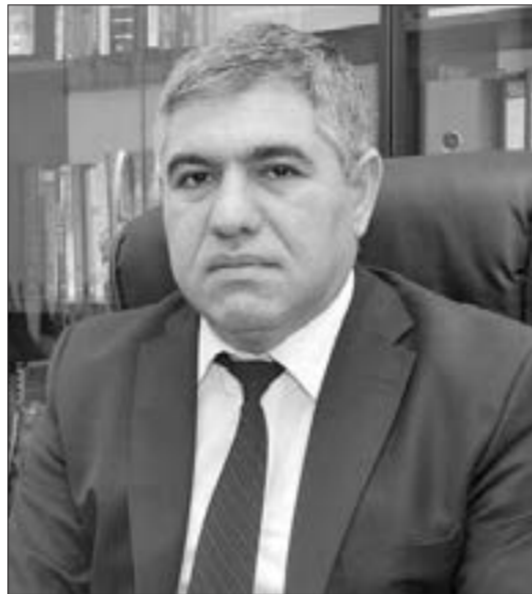
Vüqar Bayramov, Milli Məclisin deputatı

Məlumat üçün bildirik ki, bu gün ölkəmizdə ərzaq təhlükəsizliyinin daha da möhkəmləndirilməsi və aqrar-sənaye kompleksinin modernləşdirilməsi məqsədilə aqroparkların yaradılması istiqamətində işlər davam etdirilir. Hazırda 32 rayon üzrə 240 min hektar ərazidə 51 aqropark və iri fermer təsərrüfatı yaradılıb. Bunlardan 35-i bitkiçilik, 14-ü bitkiçilik və heyvandarlıq, 1-i heyvandarlıq fəaliyyəti, digəri isə çeşidləmə-qablaşdırma, emal və logistika sahələri üzrə ixtisaslaşmış. Artıq 43 aqropark fəaliyyətə başlayıb, digərlərində isə layihələndirmə işləri aparılır. İndiyədək 23 aqroparkın yaradılmasına İqtisadiyyat Nazirliyinin Sahibkarlığın İnkişafı Fondu tərəfindən 173 mln. manat güzəştli kredit, 27 aqroparka isə 1 mlrd. manat dəyə-