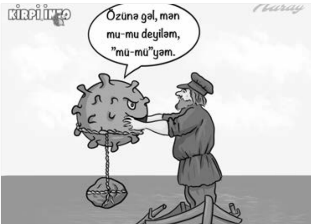
Mü ştammi gəlir!..

“ Milli Məclisin sədrinə müraciət edəcəyik