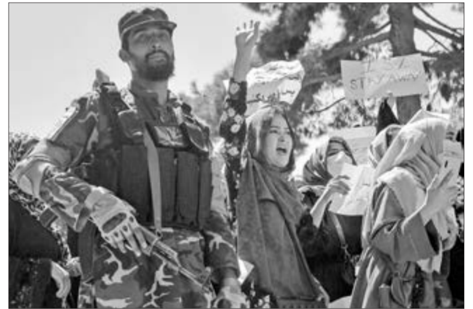
Kabildə qadınların etiraz aksiyası...