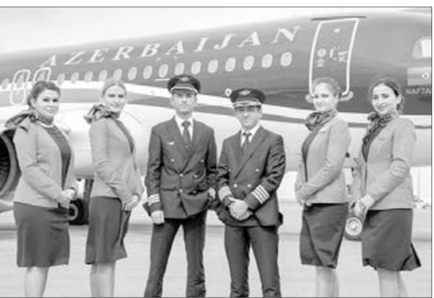
Ermənistan üzərindən ilk uçuş edən heyət...