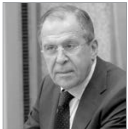
Sergey Lavrov, Rusiyanın xarici işlər naziri

"Bu günlərdə İranın sərhəd yaxınlığında keçirdiyi təlimlərlə bağlı Azərbaycanın da ifadə etdiyi narahatlıqlar mövcuddur"