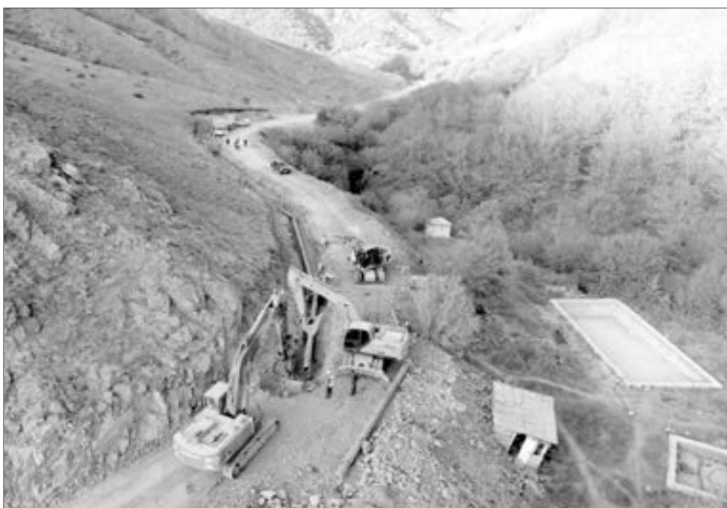
Şuşada içməli su xətləri yenidən qurulur...