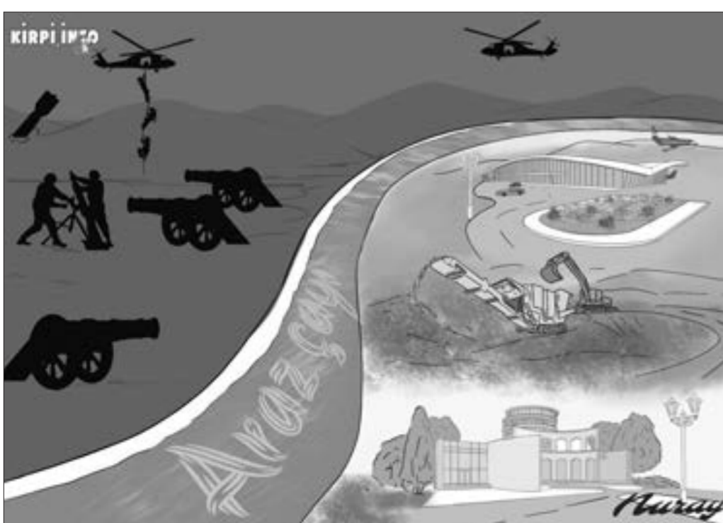
Arazın o tayı və bu tayı...

66 Müharibə əlillərinə indiyədək 7350 avtomobil verilib