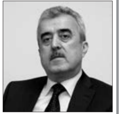
Etibar Məmmədov, Azərbaycan Milli İstiqlal Partiyasının lideri, istiqlalçı deputat

Azərbaycan Milli İstiqlal Partiyasının lideri, istiqlalçı deputat Etibar Məmmədovla hafta.az üçün budəfəki söhbətimizdə sentyabrın əvvəllərindən bəri Cənub qonşumuz İranda prezident seçkilərindən sonra yenidən formalaşmış hakimiyyətin heç bir əsaslı səbəb olmadan Azərbaycanla münasibətləri gərginləşdirməsi, Rusiya dövlətinin bu məsələyə münasibəti, ABŞ və İsrailin bu gərginlikdən Tehran rejiminə qarşı yararlanmasından və s. danışdıq, Güney Azərbaycan məsələsinə toxunduq.