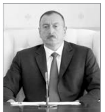
İlham Əliyev, Azərbaycan Prezidenti

“ Noyabrın 16-da sərhəddə toqquşmanı biz planlaşdırsaydıq, dayanmazdıq ”