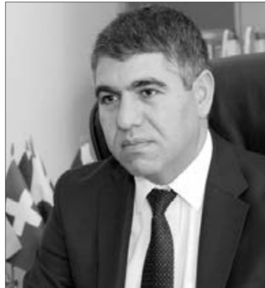
Vüqar Bayramov, millət vəkili

Ümumilikdə, prioritetlərə əsasən, 2030-cü ilə qədər iqtisadiyyatı davamlı və yüksək tempərlə artırmaqda ölkədə adambaşına düşən milli gəlirin yüksək səviyyəsinə nail olunması proqnozlaşdırılır. Bunun üçün yüksək gəlirli iş yerlərinin yaradılması, həyat səviyyəsinin ilibail yaxşılaşdırılması, iqtisadiyyatın dərin şaxələndirilməsi nəzərdə tutulub. Plana əsasən, 10 il ərzində sosial təminat sisteminin daha effektiv və ədalətli olması hesabına aşağıgəlirli və yoxsulluğa