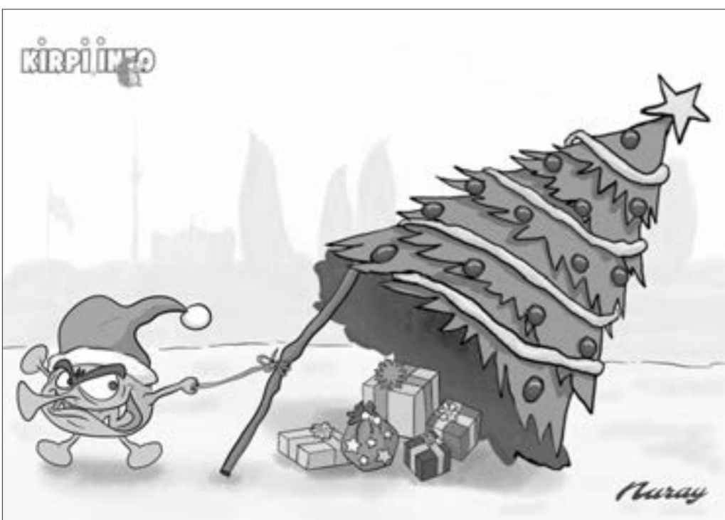
Bayram günləri və sıxlıq təhlükəsi...

“ “Media haqqında” yeni qanun daha əhatəli və genişdir ”