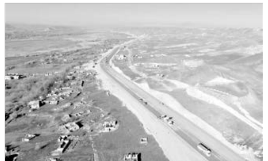
Xudafərin - Qubadlı - Laçın avtomobil yolundan son görüntü...