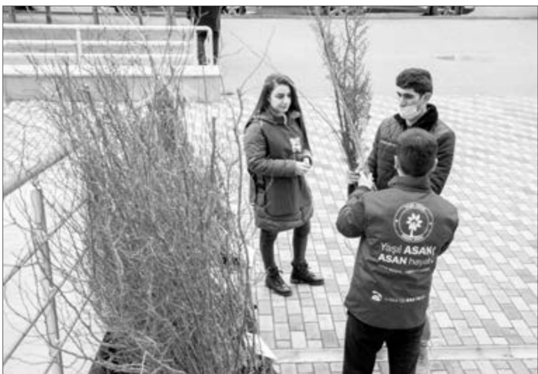
Vətəndaşlara ağac tingləri hədiyyə edildi...