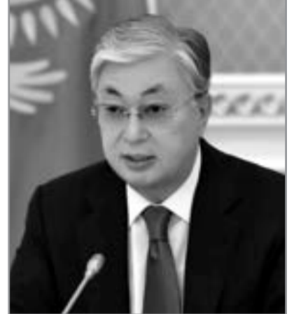
Kasım-Jomart Tokayev, Qazaxıstan prezidenti

“ Bu gündən Qazaxıstandan Kollektiv Təhlükəsizlik Müqaviləsi Təşkilatının sülhməramlı qüvvələrinin mütəşəkkil çıxarılması başlanılacaq ”