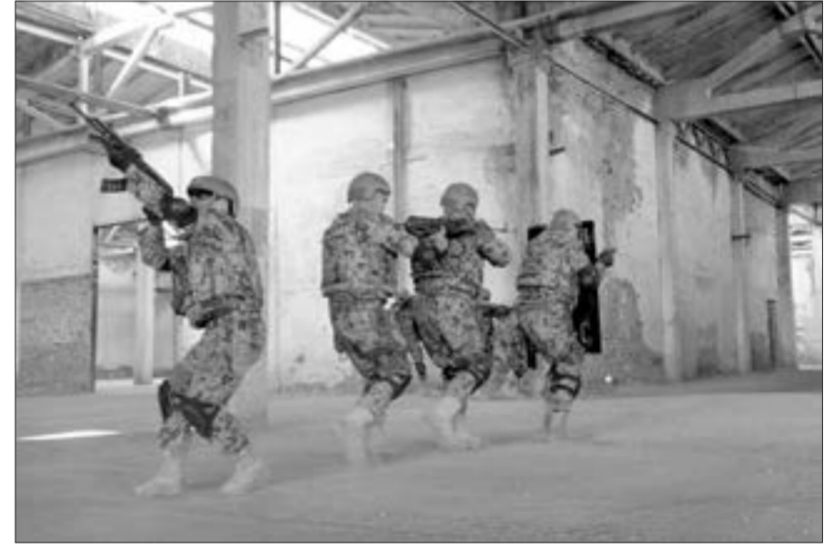
Naxçıvanda xüsusi təyinatlıların təlimi...