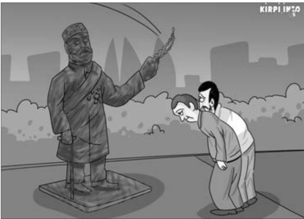
Tağyevin heykəlinə zərər vuranlara cinayət işi açıldı...