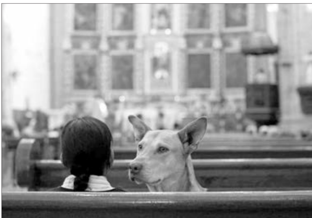
Mexiko sitidə katolik kilsəsi...

66 Parlament rus sülhməramlılara status verməməlidir