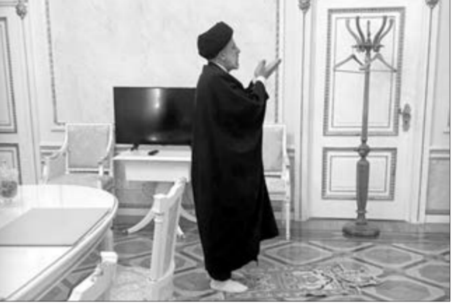
İran prezidenti Kremlə namaz qıldı...