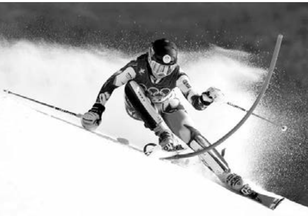
Pekin Olimpiadası davam edir...