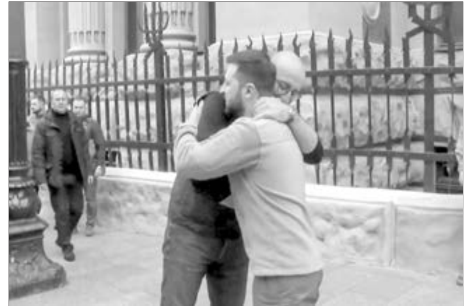
Şarl Mişel Kiyevdə Zelenski ilə görüşüb