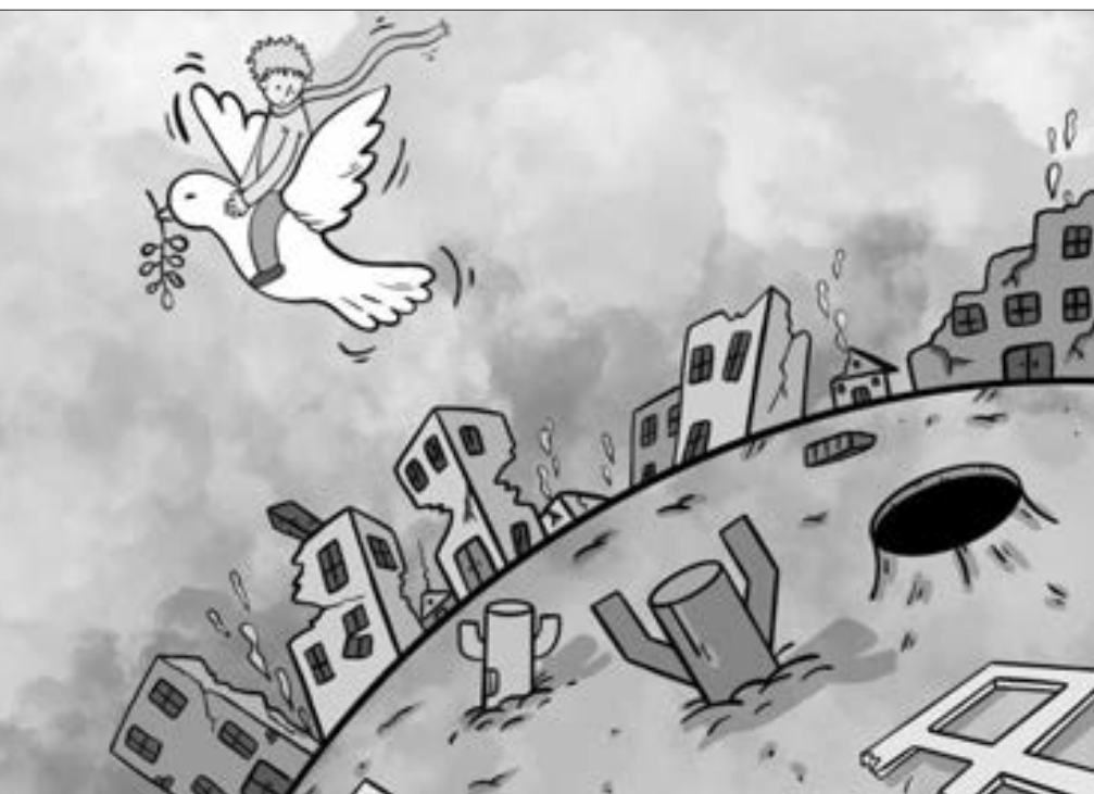
Müharibədə hamı kasıbdı

"Kiyev tədrisçən öz həyatına qayıdır..."