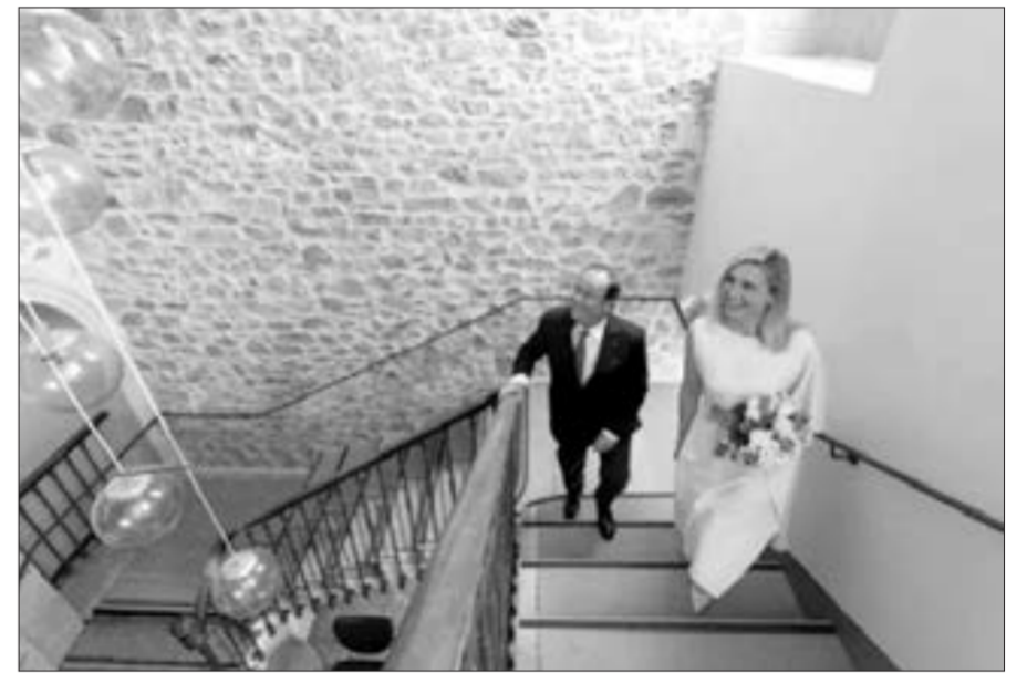
Fransua Olland 67 yaşında ilk dəfə evləndi