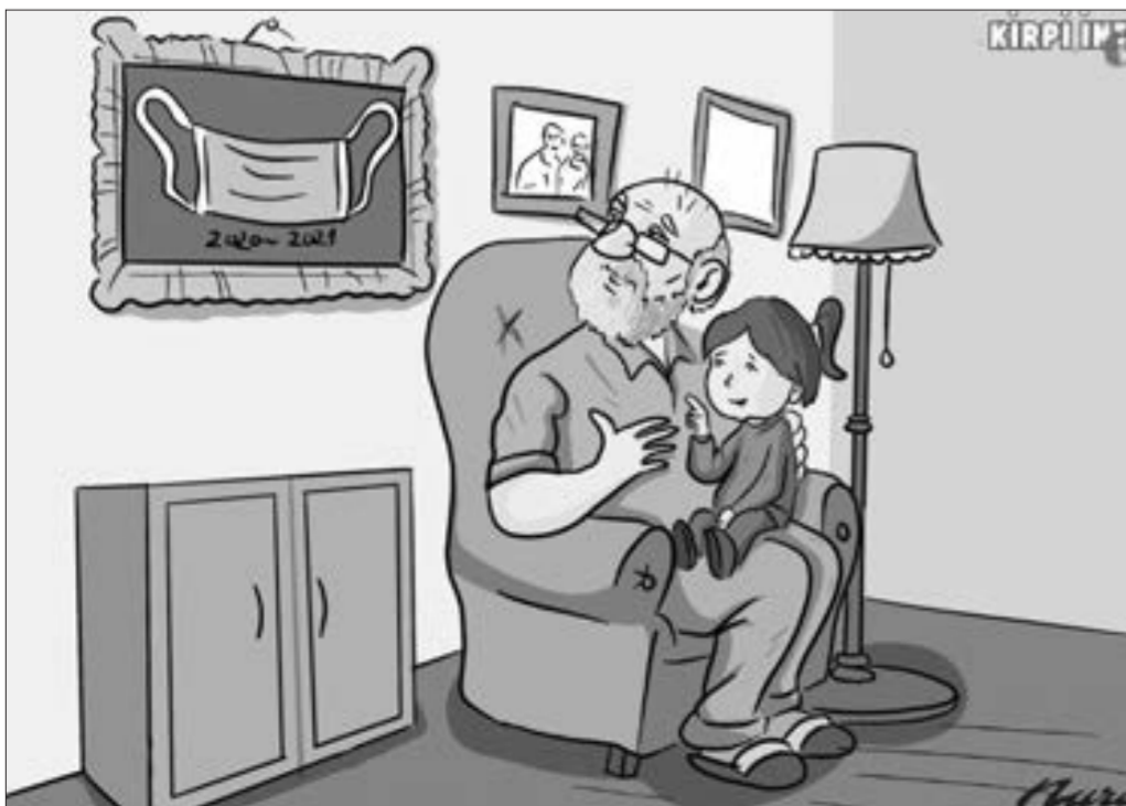
Tibbi maska tələbi qayıdır