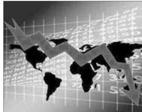
« avvalı 1-ci səhifədə

Dövlətimizin başçısı demək olar bütün məsələlərdə, toplanılarda, ictimaiyyətin nümayəndələri ilə görüşlərində nailiyyətlərlə bərabər, çatışmazlıqlardan da bəhs edir, "mütləq çox güclü ictimai nəzarət olmalıdır" deyərək cəmiyyətdən dəstək istəyir. Bu gün sürətlə yenilənən, keyfiyyətə yeni mərhələyə qədəm qoyan ölkəmizdə hüquqi dövlət quruculuğu prosesində atılan addımlar, ifadə azadlığının təmin edilməsi, vətəndaş cəmiyyəti institutlarının kifayət qədər formalaşması ictimai nəzarətin və ictimai rəyin rolunu daha da artırır. Bu baxımdan Prezident İlham Əliyevin yanvarın 12-də yerli televiziya kanallarına məsuliyyətdə dövlət nəzarəti ilə yanaşı, ictimai nəzarətin rolunu bir daha vurğulaması çox mühüm əhəmiyyət kəsb edir. Prezidentin ictimai nəzarətin təmin edilməsi baxımından media nümayəndələrinin rolunu xüsusi vurğulaması jurnalistlərin peşəkar fəaliyyətlərini yerinə yetirərək məsuliyyəti olmasını şərtləndirir. Üzərinə düşən məsuliyyəti anlayan və gündəlik işini peşə dəvranı qaydalarından irəli gələn prinsiplər əsasında quran media ictimai nəzarətçi missiyasını uğurla həyata keçirə bilər. Medianın ictimai maraqlardan irəli gələn obyektiv və qərəzsiz məlumat hazırlamaq funksiyasına layiqincə yerinə yetirməsi üçün ölkəmizdə həm ictimai-siyasi, həm də hüquqi zəmində hər cür şərait yaradılmışdır.