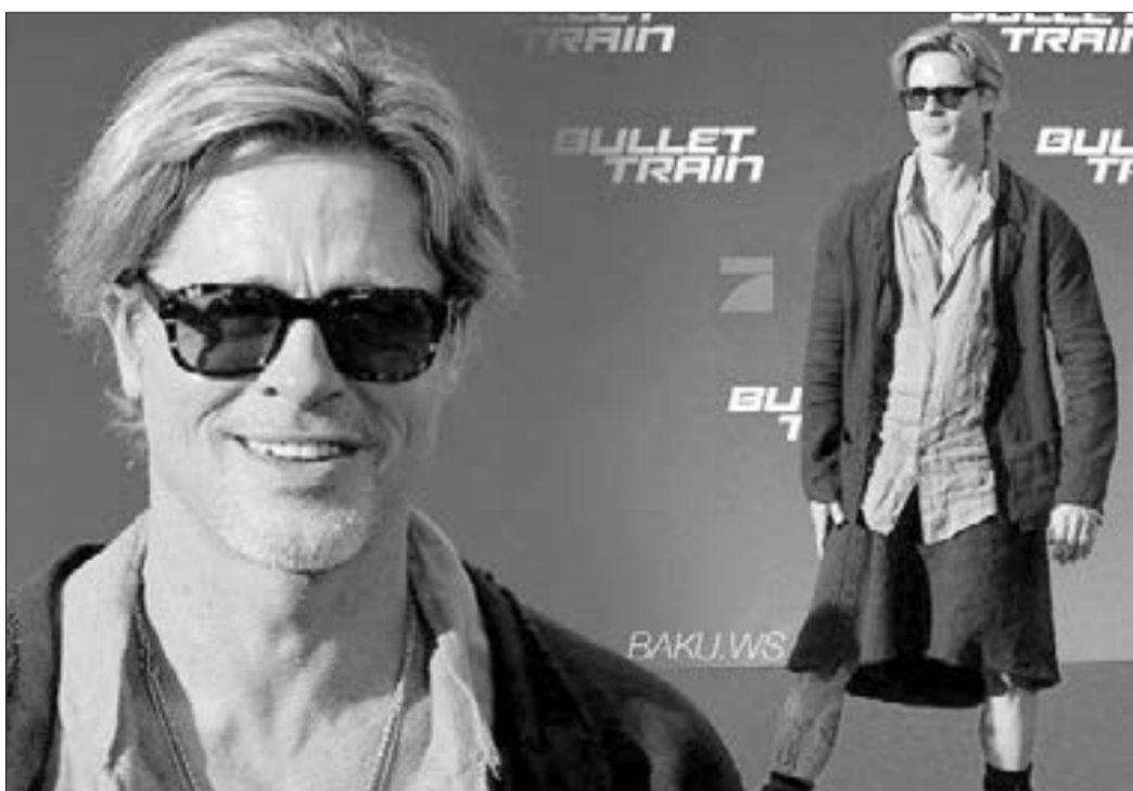
Bred Pitt qırmızı xalçaya ətkdə çıxdı