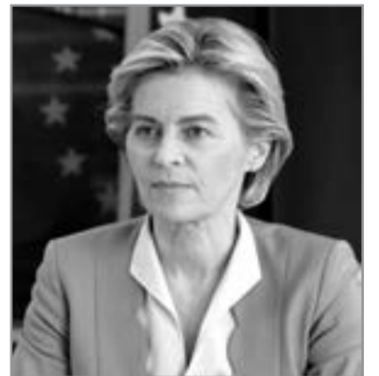
Ursula Fon der Lyayen, Avropa Komissiyasının Prezidenti

“İki gün əvvəl Azərbaycanla Anlaşma Memorandumu imzaladıq ki, bu da Avropaya qaz idxalını artırmağa imkan verəcək”