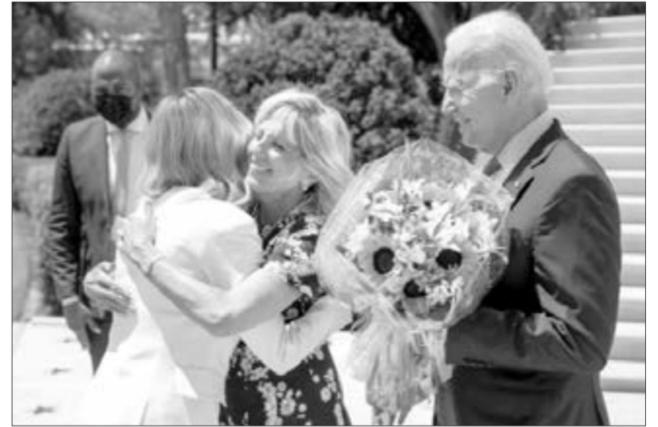
Bayden Zelenskayanı gül-çiçəklə qarşıladı