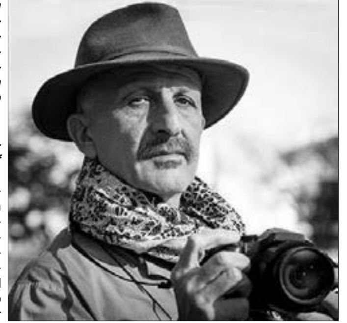
Reza Deqati, məşhur fotoqraf