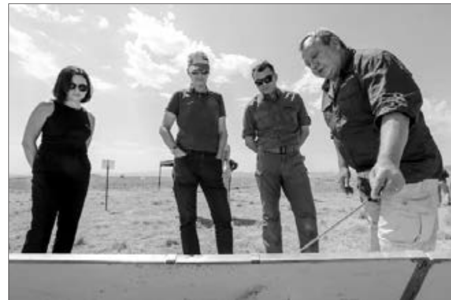
Britaniya səfiri Cəbrayılada minatəmizləməni izləyib