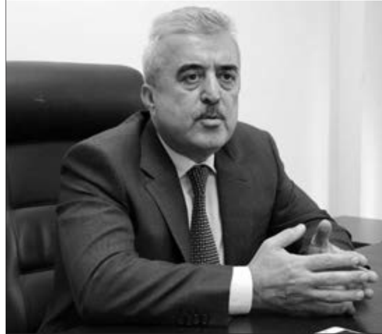
Etibar Məmmədov, Azərbaycan Milli İstiqlal Partiyasının lideri, istiqlalçı deputat

-İctimai nəzarətin bir neçə forması var; mətbuat vasitəsi ilə, seçkililə orqanlar vasitəsi ilə və inzibati qaydada... Bunun üçün seçkililə orqanlar da normal işini bərpə etməlidir. Yeni seçkililə keçirilməlidir. Və yeni özünüidare strukturları həmin icra strukturlarına nəzarət etməlidir və icra strukturları da