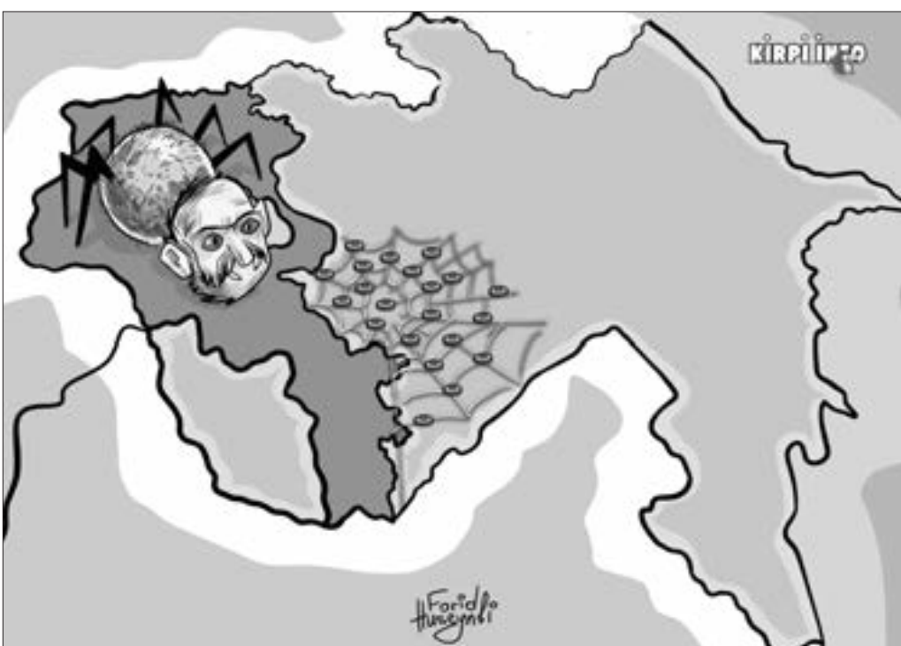
Mina terrorunun qurbanları artmaqdadır