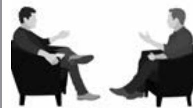
Etibar Məmmədov, AMİP lideri

■ Hesab edirəm ki, icra hakimiyyətləri ləğv olunaraq vilayətlər və valilik sistemine keçirilməlidir