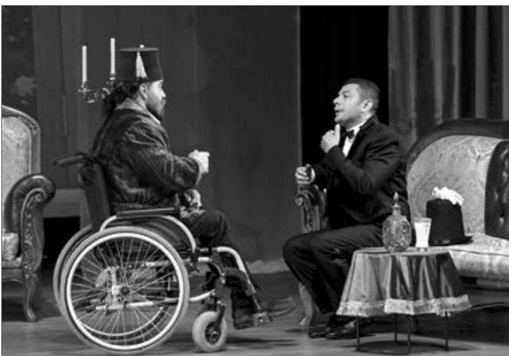
Əlil şəxslər tamaşada baş rolları ifa etdi