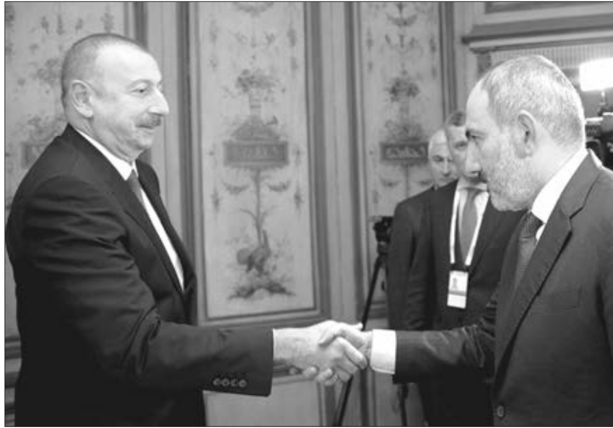
Növbəti danışıqların anonsu verildi

Prezident İlham Əliyev Azərbaycanın işğaldan azad olunmuş ərazilərində Ermənistan tərəfindən kütləvi şəkildə minaların basdırıldığını və mühari-