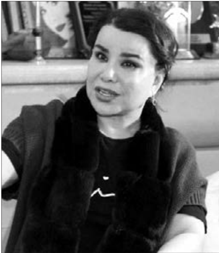
Yıldız Usmanova, Özbəkistanın məşhur müğənnisi

- Prodüссер mərkəzləri mütləq yaradılmalıdır. Müğənnilərin albomları, diskləri ora gedir və satılır. Hər bir prodüссер mərkəzi öz siyahısını qoyur ki, bizdə belə müğənnilər, bu cür mahnılar var və sair. Yeni reklamını edir. Beynəlxalq festivalların təşkilatçıları və sair də onlara sifariş edir ki, bizə mahnılardan ibarət disklər, albomlar göndərin, baxağ, dəyərləndirək və nəticədə on-