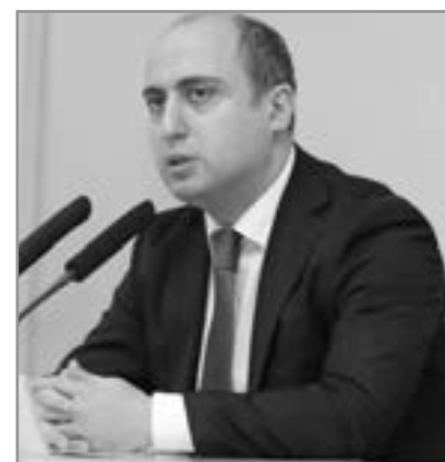
Emin Əmrullayev, Təhsil naziri

“Heç yerdə yazılmayıb ki, uşağı xarici dildə təhsilə cəlb etmək icbari məsuliyyəti, yaxud vəzifəsi var”