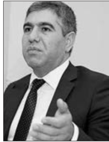
Vüqar Bayramov, millət vəkili

Global dünyanın iqtisadi inkişaf tempi özünün gərgin mərhələsini adlamaqdadır. Dünyada müşahidə olunan iqtisadi böhranla bağlı mövcud proseslər birmənalı olaraq hər bir ölkənin həyatından keçir. Belə bir vəziyyətdə, xüsusilə də postmüharibə dövrünü yaşayan Azərbaycanın özünün iqtisadi təhlükəsizliyini təmin etməsi, əhalinin sosial təminatını yüksəltməsi üçün hansı mühüm addımları atması maraqla izlənir, təhlil olunur. "Haftə içi" nə müsahibə verən iqtisadçı, deputat Vüqar Bayramov maraqlı fikirlər söyləyib.