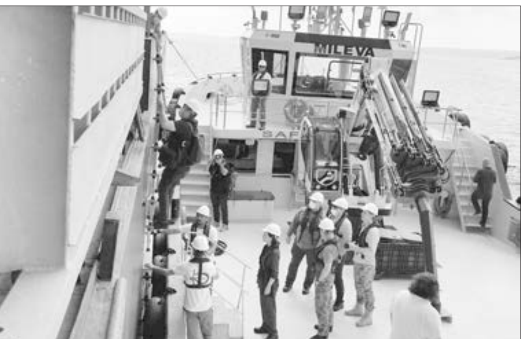
İstanbulda Ukraynadan taxıl yükü ilə gələn ilk gəmiyə baxış keçirildi