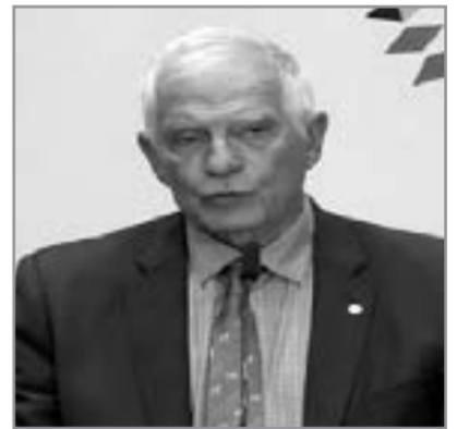
Cozep Borrell, Aİ-nin xarici siyasət və təhlükəsizlik məsələləri üzrə ali nümayəndəsi

Aİ Ukraynanın işğal olunmuş ərazilərində Rusiya tərəfindən paylanmış pasportları tanımayacaq