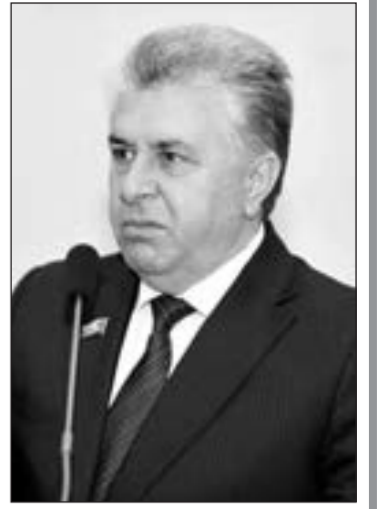
Fəzail İbrahimli, Milli Məclisin sədr müavini

"Növbəti uğurlarımızı Xocalıda, Xankəndidə əldə edəcəyik..."