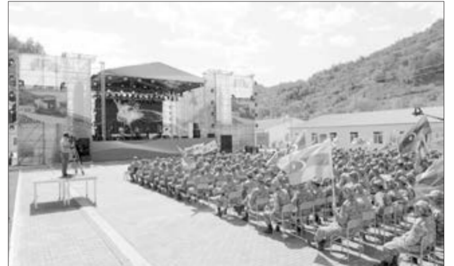
Kəlbəcərdə "Yaşa, doğma Azərbaycan!" konserti