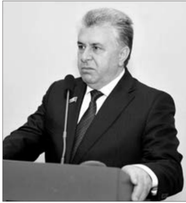
Fəzail İbrahimli, Milli Məclisin sədr müavini

F.İbrahimli hesab edir ki, son olaraq Laçının ermənilərdən təmizlənməsi sadəcə olaraq bir rayonun boşaldılması deyil, bu 200 ildən artıq ayaq tutub yeriyən böyük "Ermənistan ideologiyası"nın puça çıxması, yalanlarının bir