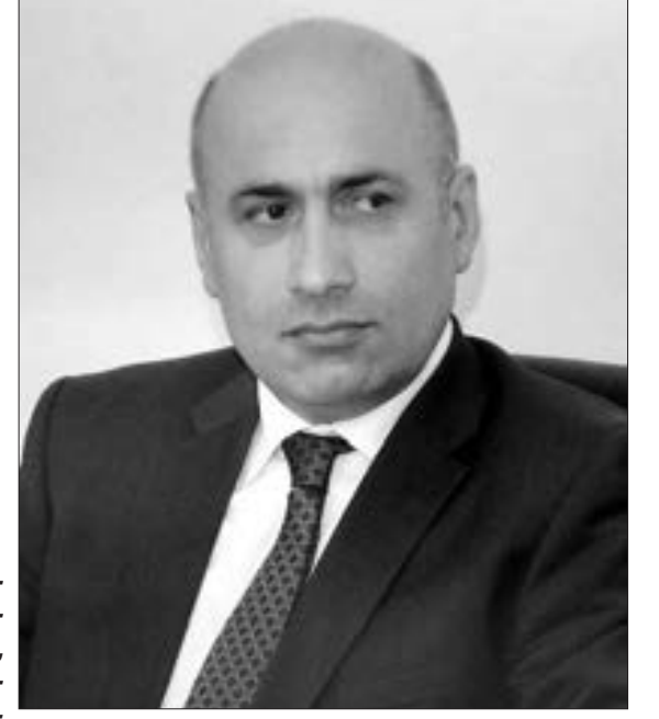
Azər Badamov, millət vəkili

Sərhəddə baş verən son tərribatlarla bağlı millət vəkili Azər Badamov "Həftə içi" nə müsahibəsində maraqlı məqamlara toxunub.