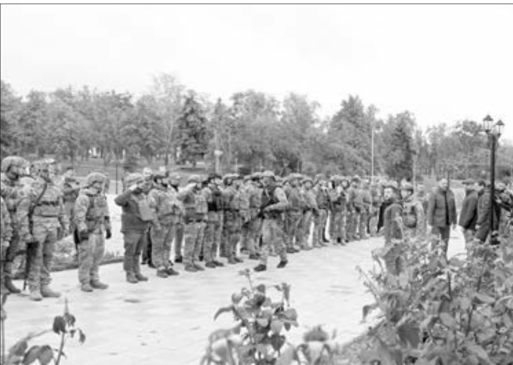
Zelenski İzyuma getdi