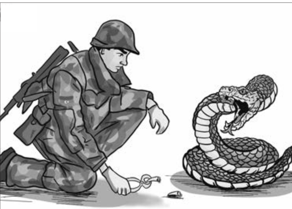
Dişi çıxarılıb, amma zəhəri qalır

"Paşinyan proseslərə nəzarət edə bilmir..."