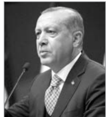
Rəcəb Tayyib Ərdoğan, Türkiyə Prezidenti

Azərbaycan-Ermənistan sərhədində baş vermiş toqquşmalar zamanı şəhid olan qardaşlarımıza Allahdan rəhmət diləyirəm, yaralılara şafa arzulayıram. Qardaşım Prezident İlham Əliyev başda olmaqla, Azərbaycan xalqına başsağlığı verirəm