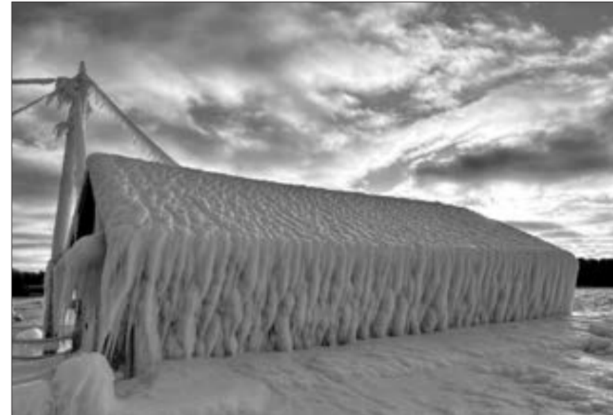
ABŞ-da buz bağlayan evlər