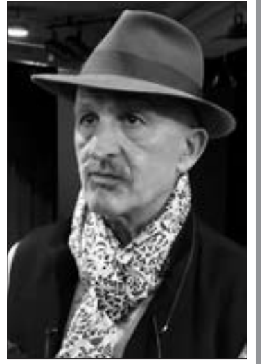
Reza Degati, dünya şöhrətli fotoqraf

"Ən maraqlı mənzərə ilə Laçında qarşılaşdıq"