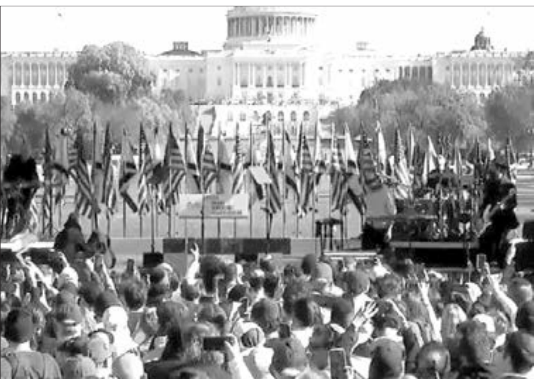
Vaşinqtonda İsrail üçün yürüş