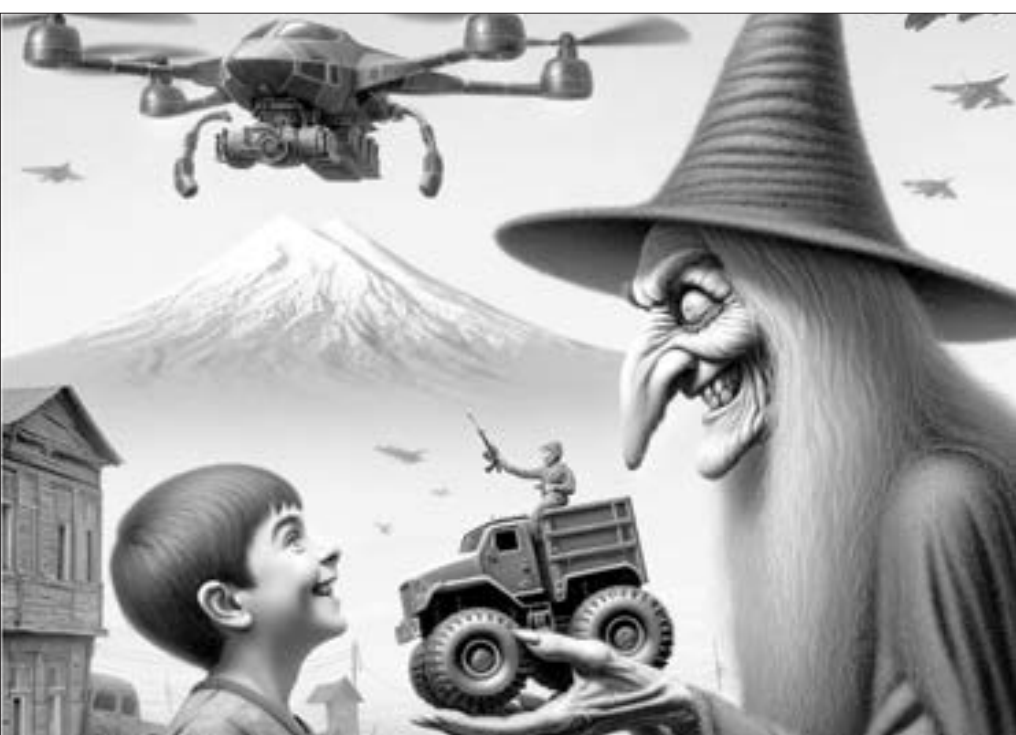
Fransa Ermənistanın başını belə aldadır