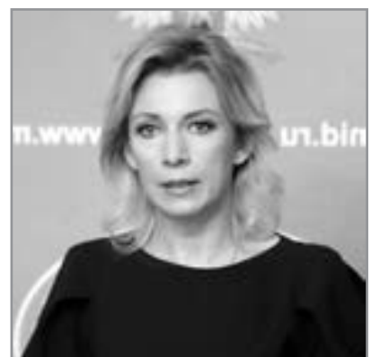
Mariya Zaxarova, Rusiya Xarici İşlər Nazirliyinin rəsmi nümayəndəsi

Rusiya Azərbaycanın Qarabağa qayıtmaq istəyən ermənilərin hüquqlarının, təhlükəsizliyinin və iqtisadi rifahının təminatı ilə bağlı bəyanatlarını alqışlayır