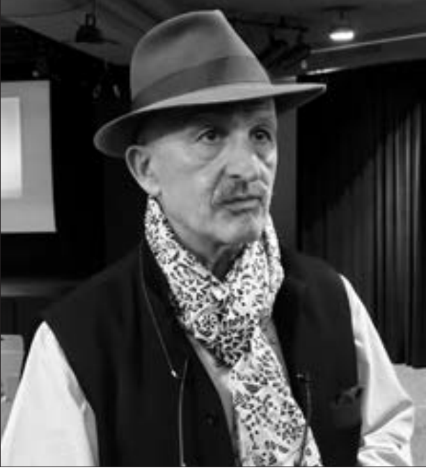
Reza Degati, dünya şöhrətli fotoqraf