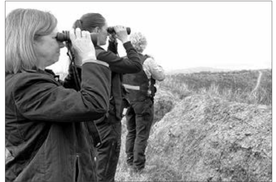
ABŞ səfiri yenidən Ermənistan-Azərbaycan sərhədində