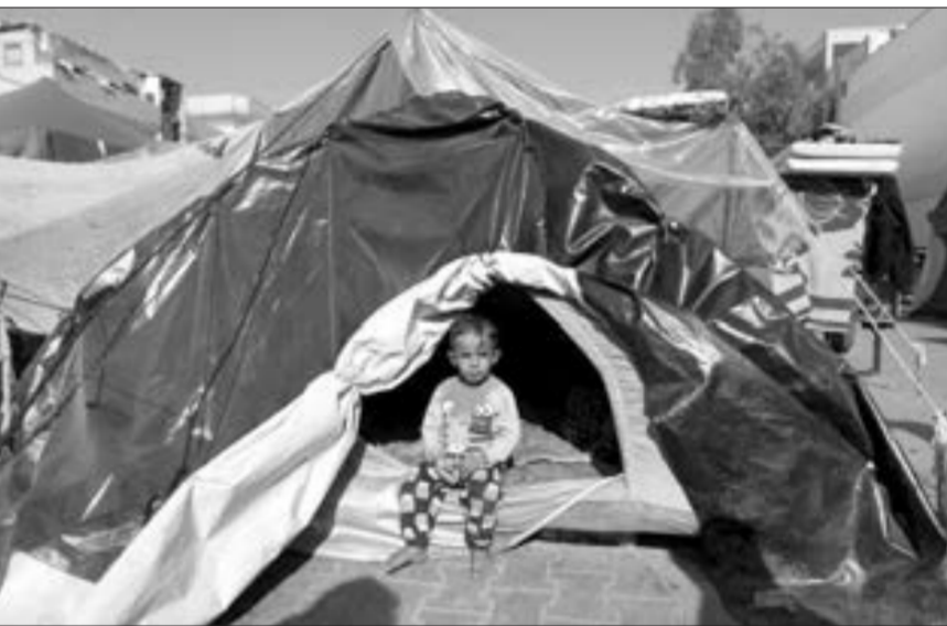
Qəzzada evlərini tərk edərək məktəbə sığınan fələstinli uşaqlar