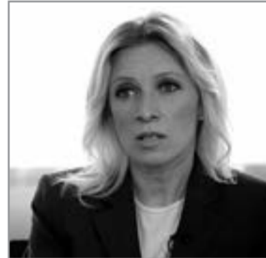
Mariya Zaxarova, Rusiya Xarici İşlər Nazirliyinin rəsmi nümayəndəsi

"Azərbaycan Moskvada görüşə razılığını təsdiqləyib, Ermənistan isə yox"