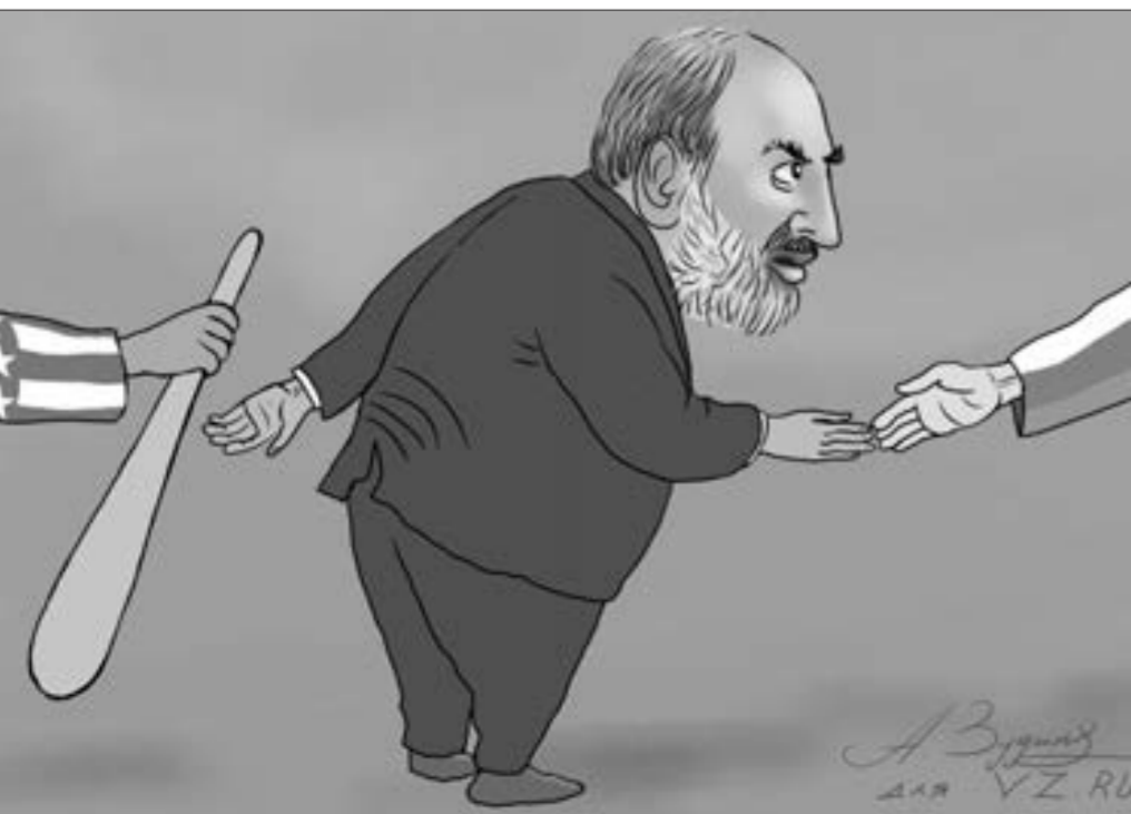
Ermənistan hakimiyyətinin mövcud siyasəti

"Separatçı "deputatlar"ın gizli toplantısı"