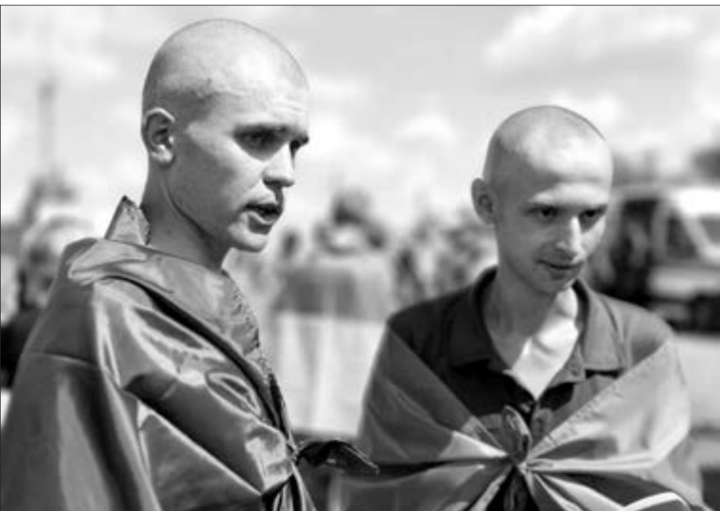
Ukrayna ilə Rusiya arasında növbəti əsir mübadiləsi